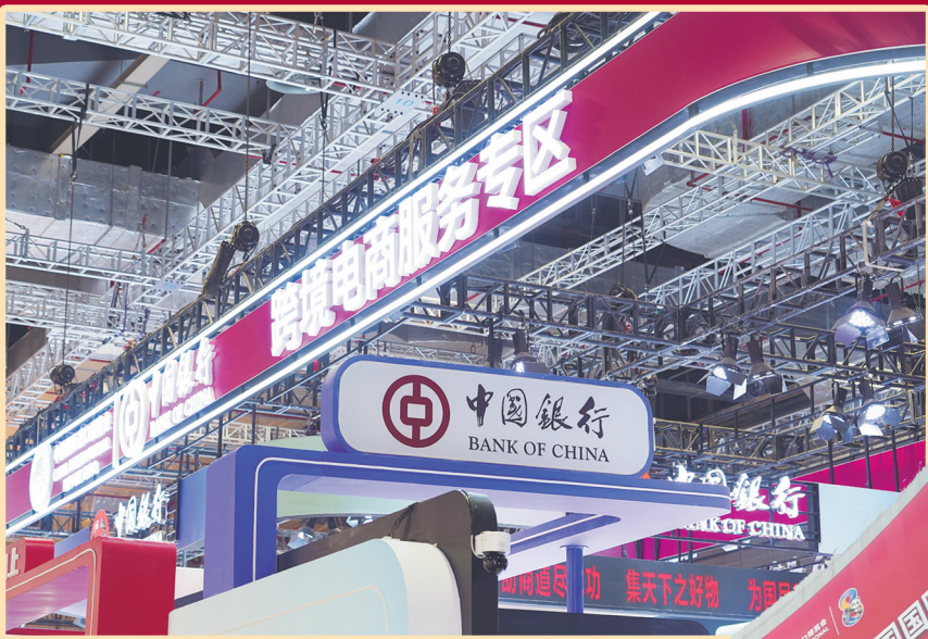
中国银行跨境电商服务专区