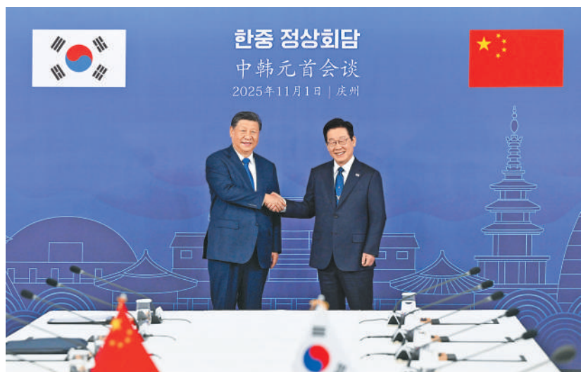
当地时间 11 月 1 日下午，韩国总统李在明同中国国家主席习近平在庆州博物馆举行会谈。

本报韩国庆州 11 月 1 日电（记者马菲、巩略）当地时间 11 月 1 日下午，韩国总统李在明同中国国家主席习近平在庆州博物馆举行会谈。 11 月的庆州，秋意正浓。习近平乘车抵达，韩国礼仪队隆重欢迎。 李在明热情迎接习近平。两国元首握手合影。 习近平同李在明登上检阅台。军乐团奏中韩两国国歌。习近平在李在明陪同下检阅仪仗队。两国元首分别同对方陪同人员握手致意。 欢迎仪式后，两国元首举行会谈。 习近平指出，中韩是搬不走的重要近邻，也是分不开的合作伙伴。建交 33 年来，两国超越社会制度和意识形态差异，积极推进各领域交流合作，实现了相互成就、共同繁荣。事实证明，推动中韩关系健康稳定发展，始终是符合两国人民根本利益、顺应时代潮流的正确选择。中方重视中韩关系，对韩政策保持连续性、稳定性，愿同韩方加强沟通，深化合作，拓展共同利益，携手应对挑战，推动中韩战略合作伙伴关系行稳致远，为地区和平与发展提供更多正能量。 习近平就开辟中韩关系新局面提出 4 点建议。 一是加强战略沟通，夯实互信根基。从长远角度看待中韩关系，在彼此尊重中共同发展，在求同存异中合作共赢。尊重各自社会制度和发展道路，照顾彼此核心利益和重大关切，通过友好协商妥善处理矛盾分歧。用好两国之间的对话渠道和交流机制，为两国关系发展汇聚力量。 二是深化互利合作，拉紧利益纽带。成就邻居就是帮助自己。中方愿同韩方秉持互利共赢原则，加快推动中韩自由贸易协定第二阶段谈判，深挖人工智能、生物制药、绿色产业、银发经济等新兴领域合作潜力，推动经贸合作提质升级。中韩两国都重视打击网络赌博和电信诈骗，可以在双边和地区层面开展合作，更好维护两国民众生命财产安全。 （下转第三版）