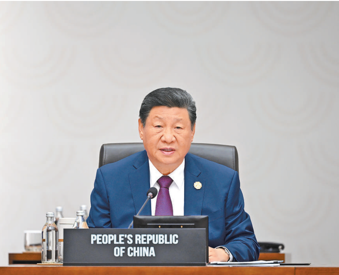
当地时间 11 月 1 日上午，国家主席习近平在韩国庆州出席亚太经合组织第三十二次领导人非正式会议第二阶段会议，并发表题为《共同开创可持续的美好明天》的重要讲话。