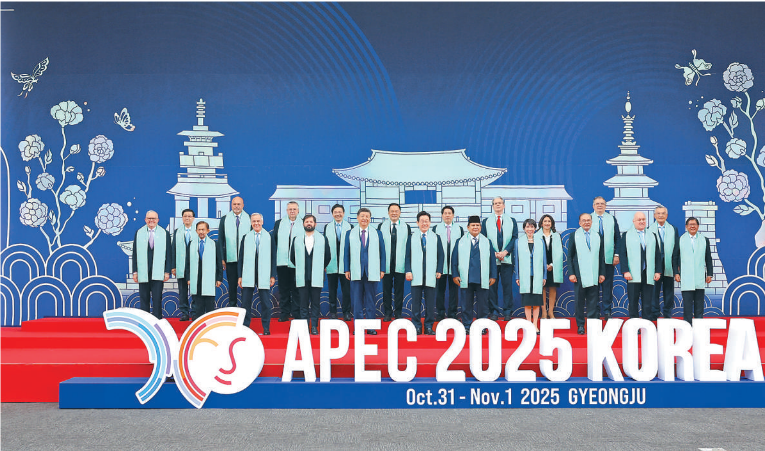
当地时间 11 月 1 日上午，国家主席习近平在韩国庆州出席亚太经合组织第三十二次领导人非正式会议第二阶段会议，并发表题为《共同开创可持续的美好明天》的重要讲话。这是会后，与会经济体领导人、代表集体合影。

■ 当前，新一轮科技革命和产业变革深入发展，为人类社会开辟了新前景。同时，世界经济增长动能不足，全球发展赤字扩大，气候变化、粮食和能源安全等挑战加剧。亚太各经济体应该加强互利合作，把握新机遇，应对新挑战，共同开创可持续的美好明天 ■ 提出 3 点建议：一是强化数智赋能，塑造亚太创新发展新优势。二是坚持绿色低碳，打造亚太可持续发展新范式。三是落实普惠共享，展现亚太包容发展新气象