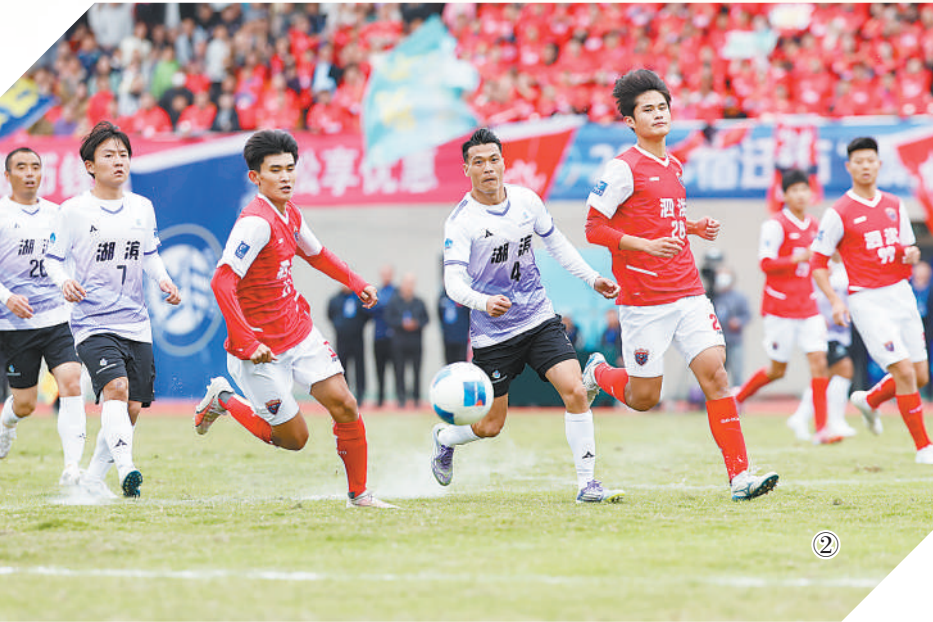
图②：江苏宿迁市泗洪县足球队和湖滨新区足球队队员在泗洪县体育场角逐。