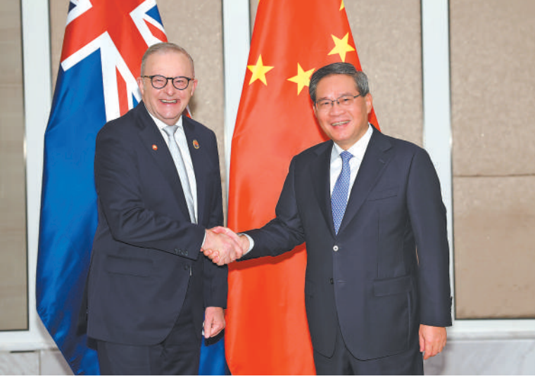
当地时间10月27日，国务院总理李强在马来西亚吉隆坡会见澳大利亚总理阿尔巴尼斯。

阿尔巴尼斯表示，当前澳中关系发展势头良好，各领域务实合作进展顺利。澳方致力于推动双边关系成熟稳定发展，愿同中方加强高层交往和各层级对话，深化相互理解，妥善管