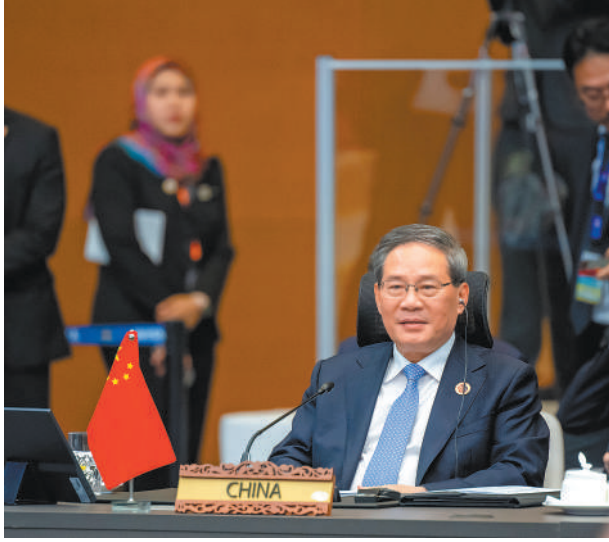
当地时间10月27日，国务院总理李强在马来西亚吉隆坡出席第五次《区域全面经济伙伴关系协定》领导人会议。

与会国家领导人表示，当前全球经济不稳定不确定性显著增多，多边贸易体制受到冲击。《区域全面经济伙伴关系协定》作为世界最大的自由贸易安排，生效以来有力促进了地区贸易投资自由化便利化，为提高地区经济增长韧性、维护产供链稳定、促进人文交流发挥了积极作用。各方应加强机制建设，积极推进扩员，持续释放潜能，在贸易、投资、创新、数字经济等领域