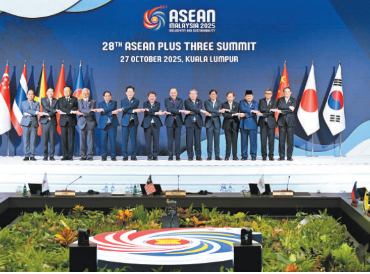
当地时间10月27日，国务院总理李强在马来西亚吉隆坡出席第28次东盟与中日韩领导人会议。

李强指出，东亚奇迹不是过去时，而是进行时。中方愿同各方共同落实好会议发表的关于加强区域经济金融合作的声明，推进财金、经贸、粮食安全等务实合作，打造更多合作亮点和增长点。三是共同培育壮大发展新动能。更大力度支持科技创新，开展联合科技攻关，不断增强“从0到1”的创新能力，提升“从1到N”的迭代效率，加强对发展的创新驱动。中方愿同各方继续深化数字经济、电动汽车、清洁能源等合作，携手抢抓发展先机。 与会国家领导人表示，东盟与中日韩合作机制成立以来，在应对挑战、促进发展方面发挥重要作用，取得丰富成果。