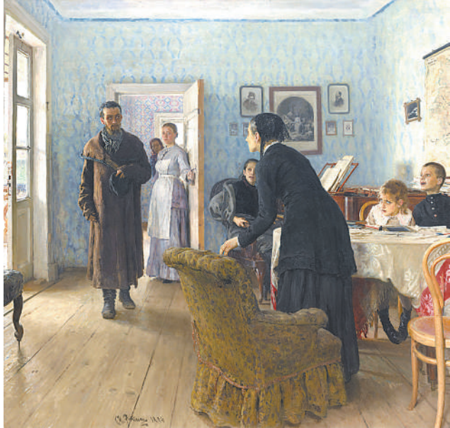
八年前。▲列宾油画《意外归来》，创作于一八八四年至一八八