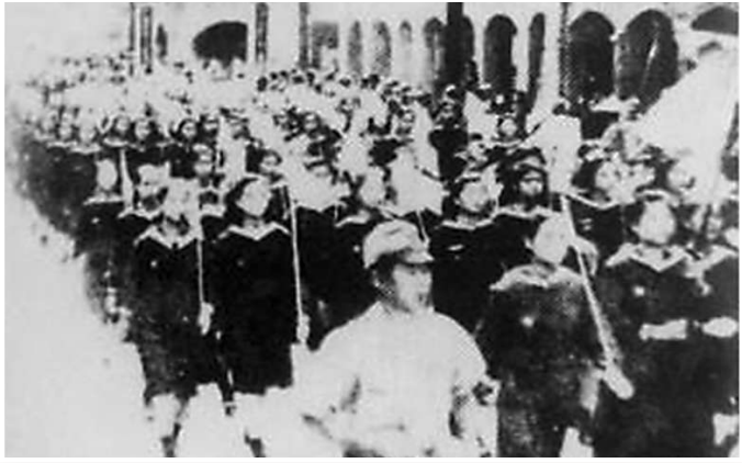
台湾民众走上街头，举办庆祝台湾光复的活动。

10月24日，十四届全国人大常委会第十八次会议表决通过关于设立台湾光复纪念日的决定，以法律形式将10月25日设立为台湾光复纪念日。 设立台湾光复纪念日，在国家层面举行纪念活动，有利于体现台湾是中国不可分割一部分这一无可辩驳的历史事实，巩固国际社会坚持一个中国的格局，引领两岸同胞传承、弘扬伟大抗战精神，激励全体中华儿女为祖国统一、民族复兴而团结奋斗。 历史将永远铭记这一刻——1945年10月25日，中国政府代表在同盟国中国战区台湾省受降仪式上向全世界宣告：自即日起，台湾及澎湖列岛已正式重入中国版图，所有一切土地、人民、政事皆已置于中国主权之下。 台湾光复了！被外族侵占奴役长达半个世纪的台湾，终于重回祖国怀抱！那响彻云霄的欢呼、扬眉吐气的喜悦，如潮水般在台湾全岛蔓延开来。 “全岛各处，欢歌燕舞，家家户户，祭祖谢神，告慰先灵……”基隆港的码头上，到处是人潮如涌，到处是欢声笑语。年轻的母亲抱着孩子来了，80岁的老翁拄着拐杖来了，人们激动地挥舞着连夜缝制的旗帜，热烈欢迎从大陆来的官兵，为台湾的光复与新生欢呼雀跃。 中华民族发展史上，两岸同胞从来都是命运相连、荣辱与共。 习近平总书记抚今追昔，深刻指出：“两岸同胞虽然隔着一道海峡，但命运从来都是紧紧连在一起的。民族强盛，是同胞共同之福；民族弱乱，是同胞共同之祸。经历了近代以来的这么多风风雨雨，我们对此都有很深刻的体会。” 130年前，台湾惨遭外族侵占，是中华民族近代屈辱的缩影，给全民族留下了刻骨铭心之痛。当《马关条约》签订的消息传到台湾，民众“奔走相告，聚哭于市中，夜以继日，哭声达于四野，风云变色，若无天地”。 “愿人人战死而失台，决不愿拱手而让台。”长达50年的漫漫黑夜中，台湾同胞始终怀着强烈的中华民族意识、牢固的中华文化情感—— “与其生为降虏，不如死为义民”，台湾同胞不畏强暴，前仆后继，展开了轰轰烈烈的抗日武装斗争，65万多人牺牲罹难；全面抗战爆发后，台湾义勇队、台湾少年团高喊“欲救台湾，必先救祖国”的口号，奋勇投身全民族的抗日救亡运动。 面对日本所谓“皇民化”运动，“义不臣倭”的台湾士绅林献堂，傲然坚持一生不读日文、不说日语、不着和服；爱国志士林祖密将军，放弃庞大家产，慨然道“大汉之民，何能因财富而辱于倭奴”，成为1911年后台湾同胞恢复中国国籍第一人。 …… 这些鲜活的面容，这些铿锵的声音，生动昭示了台湾同胞骨子