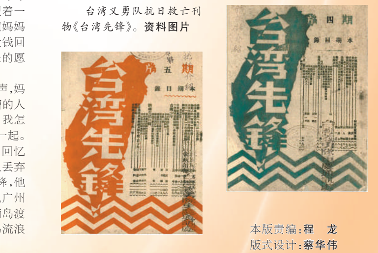
台湾义勇队抗日救亡刊物《台湾先锋》。资料图片 本版责编：程 龙 版式设计：蔡华伟

台湾光复，是中华民族近代史上浓墨重彩的一页，是包括台湾同胞在内的全体中华儿女赢得抗日战争胜利的重要成果。这一伟大的历史时刻，凝聚着无数中华儿女的鲜血与牺牲。让我们以史为鉴，共同维护国家统一，为实现中华民族的伟大复兴而共同努力。 ——台湾青年学生林彦辰 台湾光复，是先辈用牺牲和奉献换来的团圆，需要我们永远铭记。我们要坚决反对“台独”分裂，传承弘扬中华优秀传统文化，积极参与两岸交流。 ——台湾青年学生王玉婷