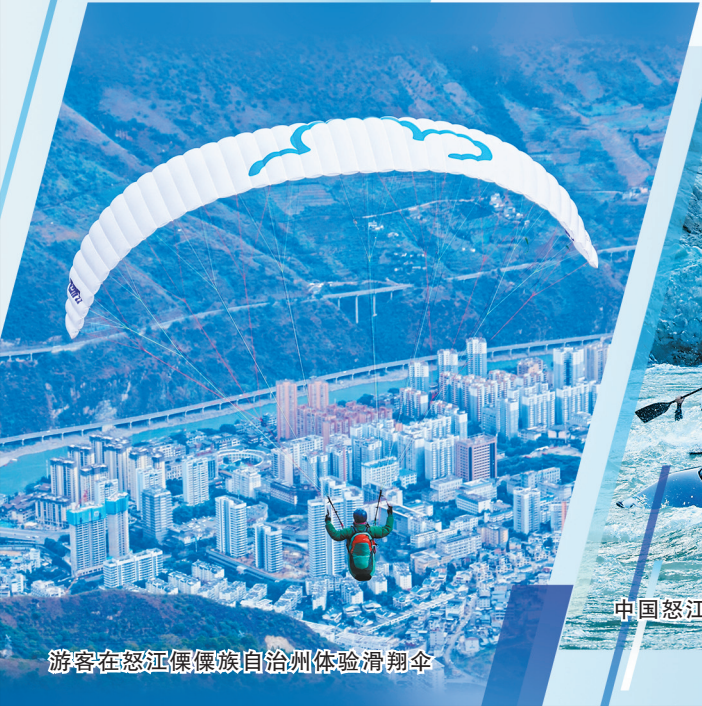
游客在怒江傈僳族自治州体验滑翔伞