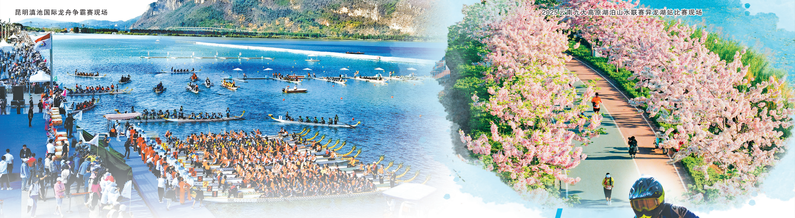
昆明滇池国际龙舟争霸赛现场