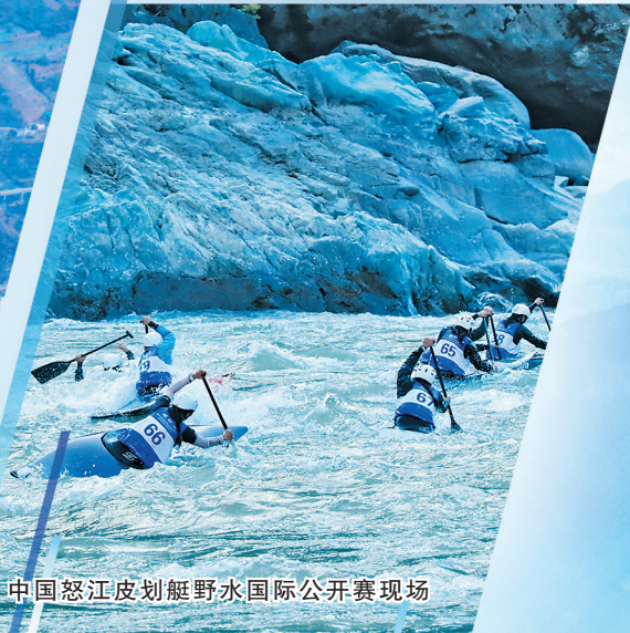
中国怒江皮划艇野水国际公开赛现场