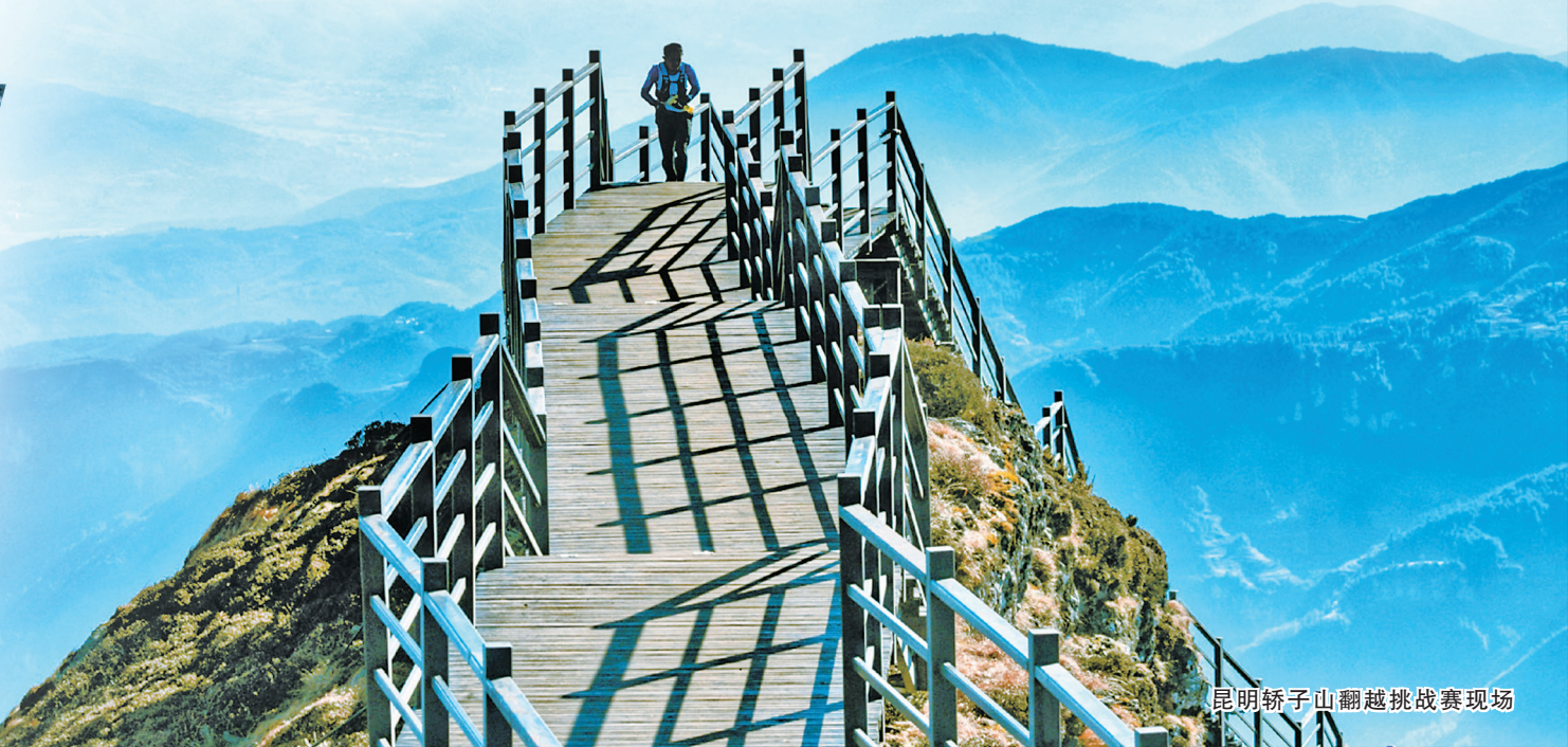
昆明轿子山翻越挑战赛现场