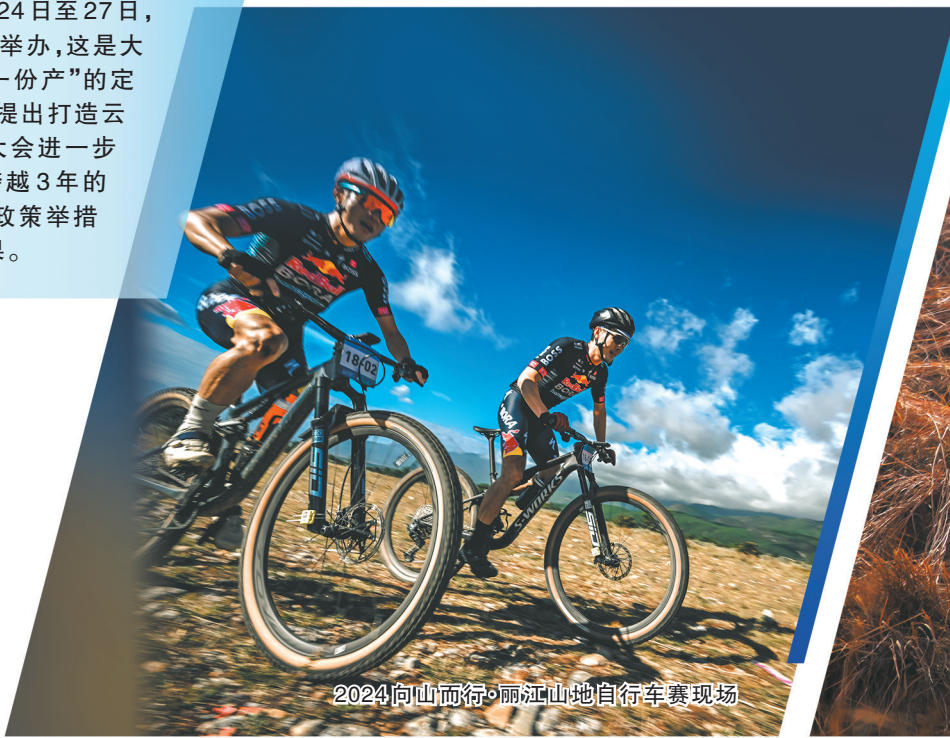
2024向山而行·丽江山地自行车赛现场