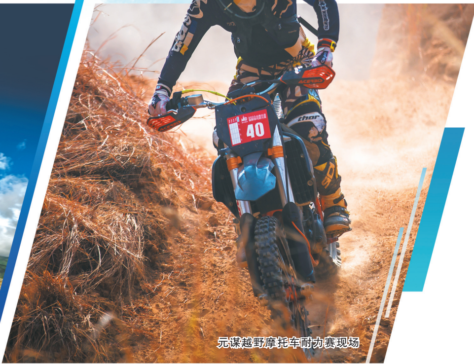
元谋越野摩托车耐力赛现场