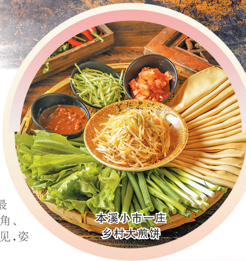
本溪小市一庄 乡村大煎饼