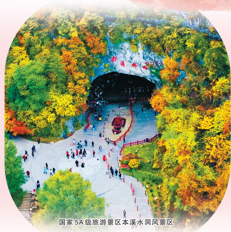
国家5A级旅游景区本溪水洞风景区