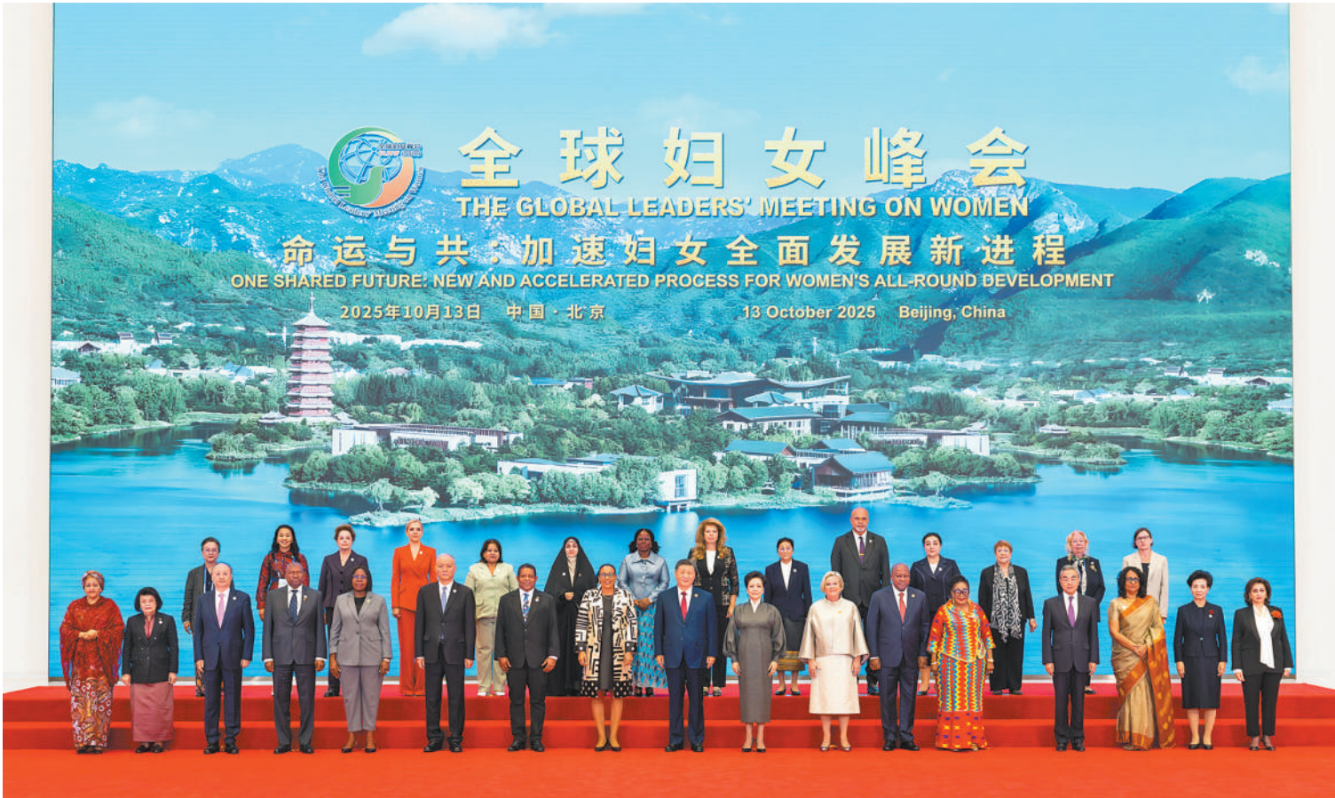
10月13日上午，国家主席习近平在北京国家会议中心出席全球妇女峰会开幕式并发表主旨讲话。这是习近平和夫人彭丽媛同与会各国和国际组织代表团团长夫妇合影留念。

本报北京10月13日电（记者胡泽曦、屈佩）10月13日上午，国家主席习近平在北京国家会议中心出席全球妇女峰会开幕式并发表主旨讲话。 金秋时节，天朗气清。国家会议中心会场内，各国国旗和联合国旗帜组成恢弘旗阵。 习近平和夫人彭丽媛同与会各国和国际组织代表团团长夫妇亲切握手并合影留念。 在热烈的掌声中，习近平发表题为《弘扬北京世妇会精神 加速妇女全面发展新进程》的主旨讲话。 习近平指出，妇女是人类文明的重要创造者、推动者、传承者，推进妇女事业发展是国际社会的共同责任。30年前，北京世妇会确立“以行动谋求平等、发展与和平”的崇高目标，通过了具有里程碑意义的《北京宣言》和《行动纲领》，将性别平等刻入时代议程，激励全世界的人们为之接续奋斗。30年来，在北京世妇会精神指引下，全球妇女事业蓬勃发展，为人类文明进步增添了亮丽色彩。追求男女平等已经成为国际社会普遍共识，妇女赋权取得显著进步，女性受教育水平不断提高，在经济、政治、文化、社会生活中发挥着更加重要的作用。一大批杰出女性走上国际舞台，演绎精彩人生、贡献智慧力量。 习近平强调，当前，妇女全面发展仍然面临复杂挑战，实现男女平等任重道远。展望未来，各方要重温北京世妇会初心，为加速妇女全面发展新进程凝聚更广泛共识、开辟更广阔道路、采取更务实行动。习近平提出4点建议： 第一，共同营造有利于妇女成长发展的良好环境。要秉持共同、综合、合作、可持续的安全观，维护世界和平。加强对战乱冲突、贫困灾害地区妇女和女童的保护。健全和完善反暴力机制，坚决打击针对妇女的一切形式的暴力行为。 第二，共同培育推动妇女事业高质量发展的强劲动能。要着力解决全球妇女发展不平衡不充分问题，让全体妇女共享经济全球化成果。以科技创新赋能妇女事业高质量