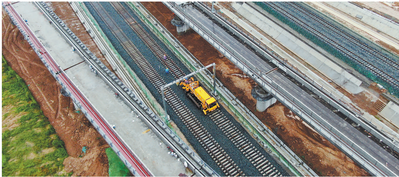
10月11日,在西康(陕西西安至安康)高铁建设现场,施工人员进行首对500米长的无缝钢轨铺设在无缝轨道板上,这标志着西康高铁全线铺轨正式启动。穿越秦岭山脉的西康高铁,新建正线全长171公里,设计时速350公里。 图为当日,施工车辆在西康高铁西安东站至牛背梁站区间铺设无缝钢轨。

——社会保障不断夯实。医疗、养老保险制度实现全覆盖,2024年参加基本医疗保险的妇女达6.51亿,占参保总人数的49.1%。 (下转第四版)