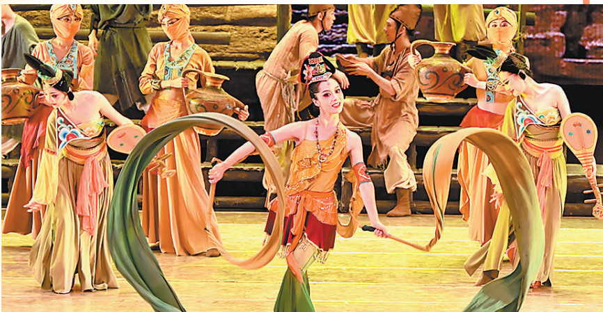
10月3日,舞剧《大梦敦煌》在甘肃省敦煌大剧院上演,为观众带来视觉文化盛宴。