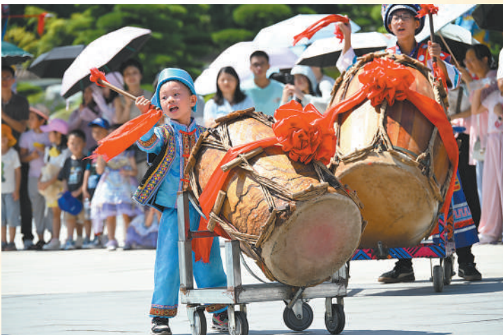
10月3日,广西南宁园博园,马山壮族会鼓表演吸引游客观看。