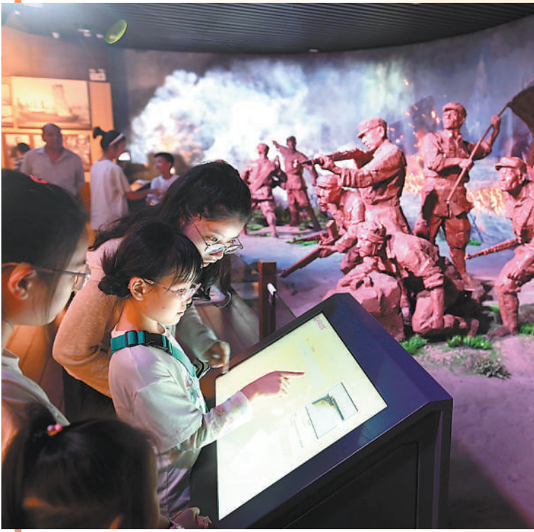
10月7日,安徽合肥渡江战役纪念馆,游客通过多媒体技术了解当年百万雄师过大江的细节。