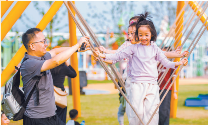
10月5日,江苏省宿迁市宿城区,游客在快乐玩耍。