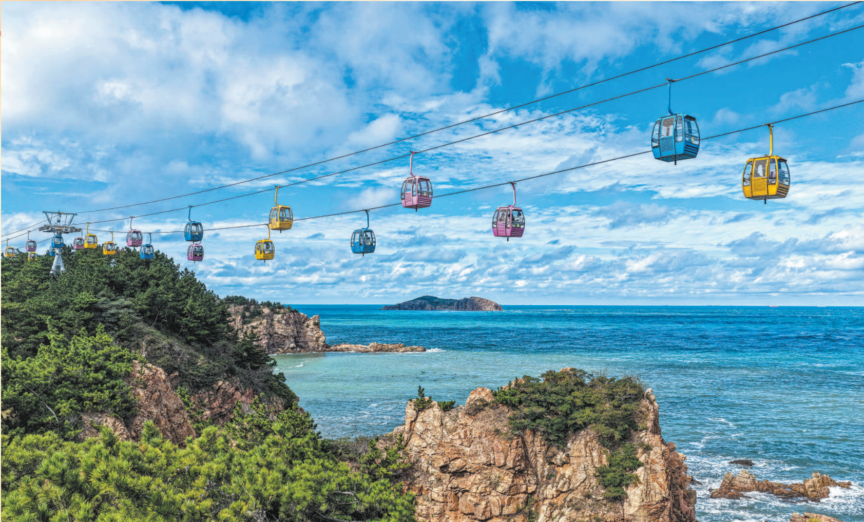
10月7日,山东省荣成市成山头风景区,游客乘坐跨海索道,赏山海美景。