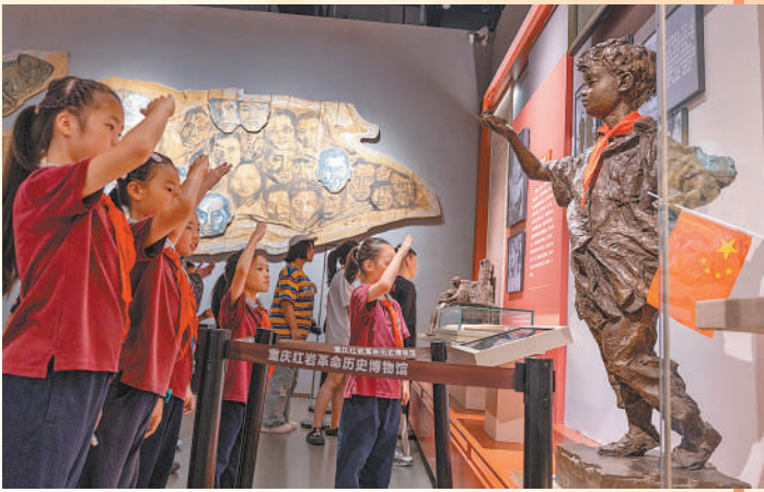
10月6日,重庆歌乐山革命纪念馆,学生在参观。