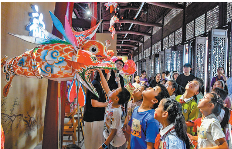
10月1日,浙江省金华市非遗馆,游客在欣赏浦江鱼灯。