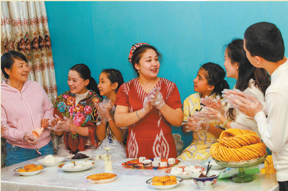
新疆乌鲁木齐市天山区黑甲山街道大湾北路西社区,各族群众在一起做月饼。