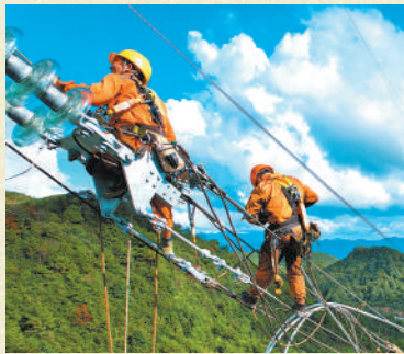
浙江省电力公司施工人员坚守岗位,对浙江天台抽水蓄能电站500千伏送出工程进行架线作业。