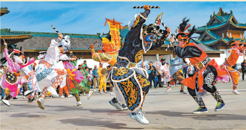
▲内蒙古鄂尔多斯市伊金霍洛旗鄂尔多斯文化产业园,民间艺人在表演潮汕英歌舞。