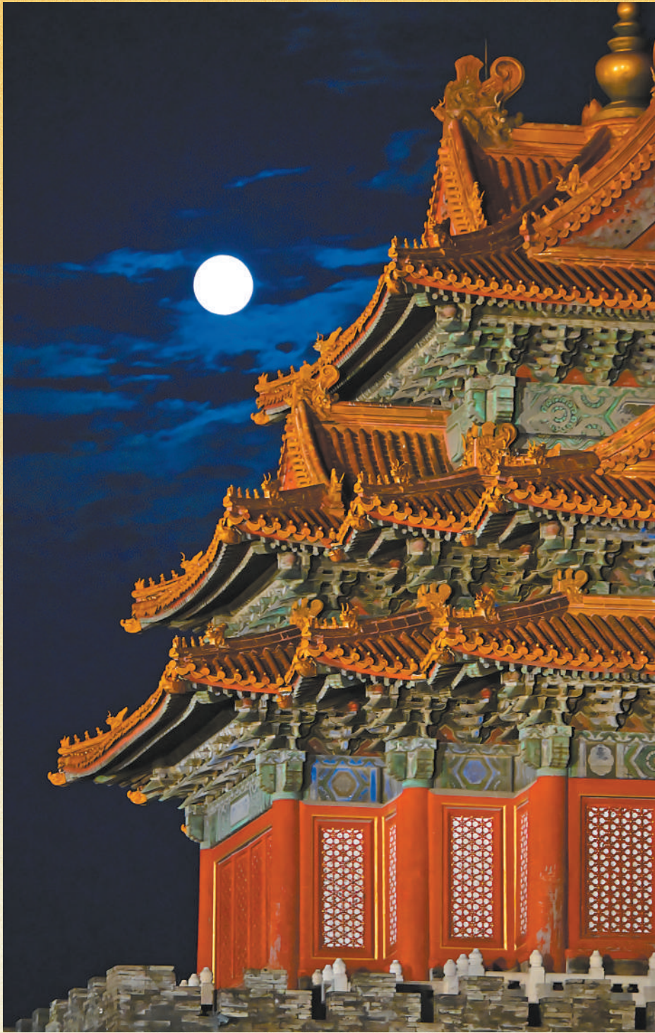
中秋圆月与北京故宫角楼同框。