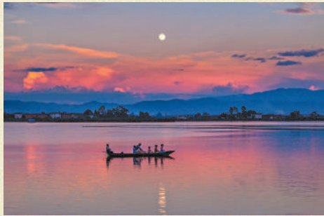
游客在云南大理洱海西湖赏月。