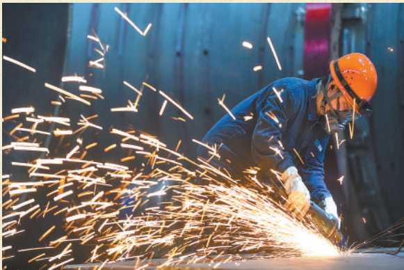
位于河南洛阳市的中信重工铆焊车间,工人在加工矿用磨机产品。