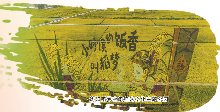
沈阳稻梦空间稻米文化主题公园

9月29日，2025辽宁省航空产业发展大会暨沈阳法库国际飞行大会精彩启幕。大会期间将举行特色飞行表演、低空应用场景展示、专业低空赛事等展演活动，还将开展中国“飞来者”大会、“空中婚礼”、航空主题嘉年华、美食节等趣味活动。9月30日、10月1日为游客开放日，连续两天为市民游客带来“陆地欢庆”与“蓝天梦想”的双重体验。