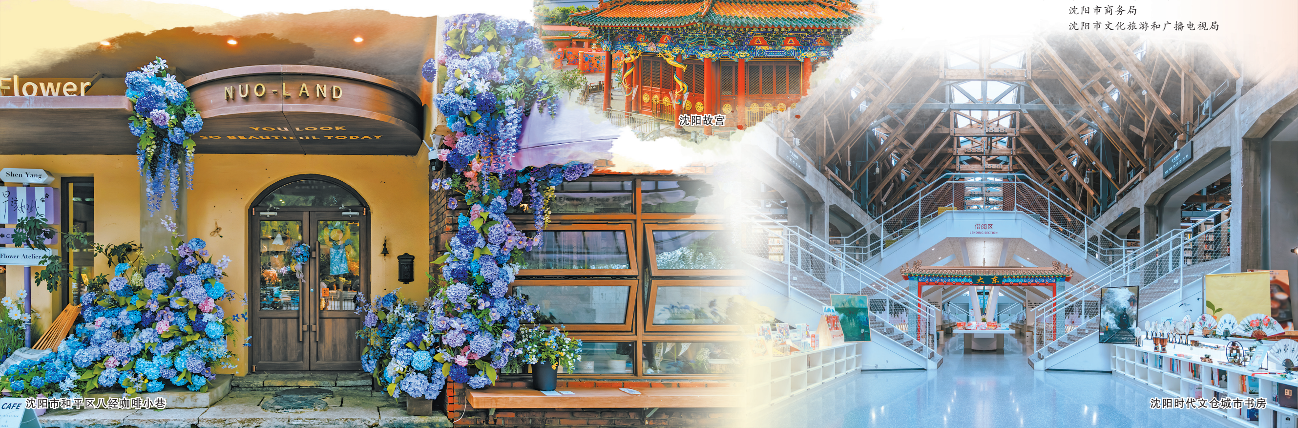
CAFE 沈阳市和平区八经咖啡小巷