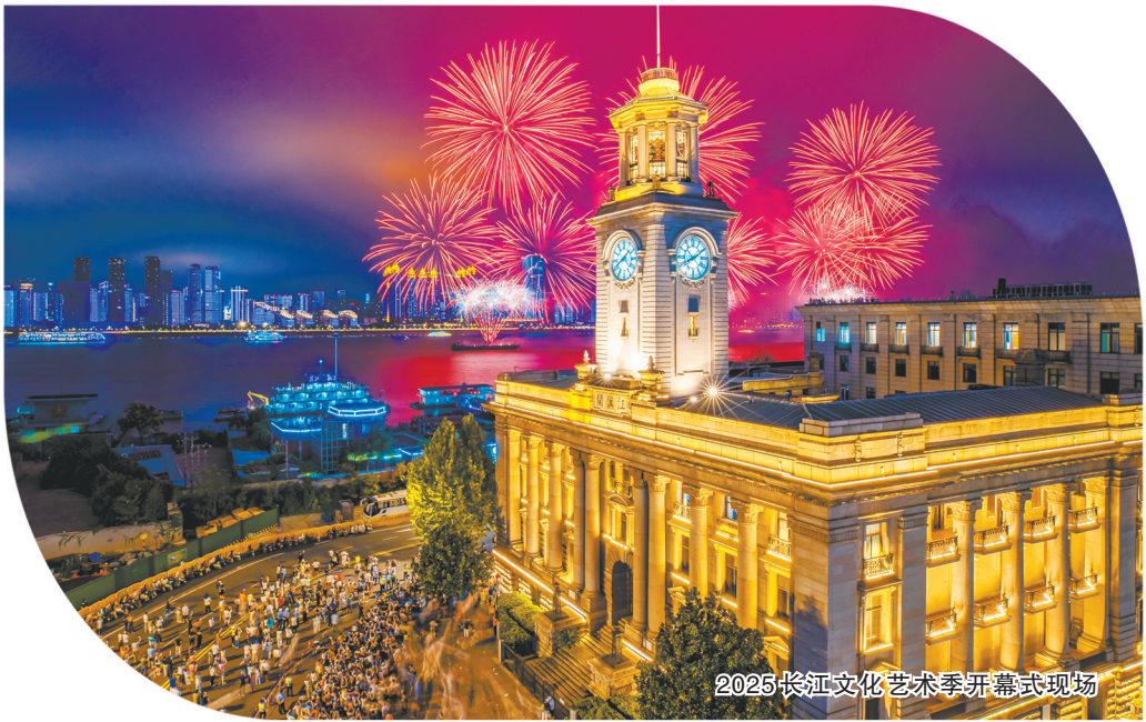
2025长江文化艺术季开幕式现场