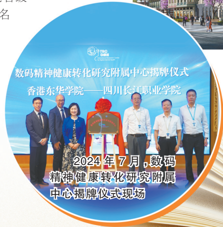
2024年7月,数码精神健康转化研究附属中心揭牌仪式现场