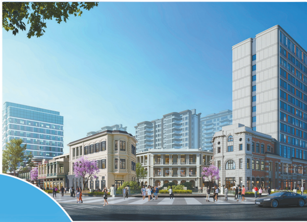
蓉港产教融合园二期项目效果图,项目位于成都市龙泉驿区