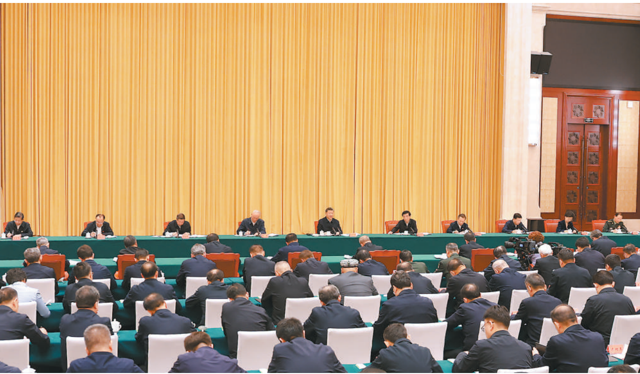
9月24日下午，率中央代表团出席新疆维吾尔自治区成立70周年庆祝活动的中共中央总书记、国家主席、中央军委主席习近平在乌鲁木齐听取新疆维吾尔自治区党委和政府工作汇报，发表了重要讲话。

本报乌鲁木齐9月24日电 率中央代表团出席新疆维吾尔自治区成立70周年庆祝活动的中共中央总书记、国家主席、中央军委主席习近平，24日听取新疆维吾尔自治区党委和政府工作汇报。他强调，新疆要完整准确全面贯彻新时代党的治疆方略，坚持稳中求进工作总基调，统筹发展和安全，牢牢扭住社会稳定和长治久安工作总目标，紧紧围绕铸牢中华民族共同体意识、推进中华民族共同体建设，锚定中央赋予的“五大战略定位”，凝心聚力、久久为功，努力建设团结和谐、繁荣富裕、文明进步、安居乐业、生态良好的社会主义现代化新疆。 习近平指出，新疆维吾尔自治区成立70年来，在党中央坚强领导和全国人民大力支持下，自治区党委和政府团结带领全区各族干部群众坚定维护国家统一、民族团结、社会稳定，持续推动经济社会发展，新疆面貌发生翻天覆地的变化，同全国各地一道如期全面建成小康社会、迈上全面建设社会主义现代化国家新征程。他代表党中央，向新疆各族干部群众表示热烈祝贺、致以诚挚问候！ 习近平强调，要立足资源禀赋和产业基础，积极探索符合新疆特点的高质量发展路子。坚持发展特色优势产业，培育有竞争力的产业集群。加强科技创新和产业创新深度融合，因地制宜发展新质生产力。强化文旅融合，促进文化旅游业发展。加强生态系统保护和修复，推动经济社会发展全面绿色转型。加快推进丝绸之路经济带核心区建设，在促进国内国际双循环中发挥更大作用。把保障和改善民生放在优先位置，巩固拓展脱贫攻坚成果，大力发展社会事业，让各族群众广泛参与发展进程、共享发展成果。 习近平指出，要全力维护新疆社会大局稳定。坚持抓基层、强基础、固根本，筑牢反恐维稳的人民防线。铸牢中华民族共同体意识、推进中华民族共同体建设，推进我国宗教中国化，加强文化润疆、注重以文化人，引导各族干部群众树立正确的国家观、历史观、民族观、文化观、宗教观。 习近平强调，加强党的领导和党的建设是推进新疆现代化建设的根本保证。要持续加强理论武装，用新时代中国特色社会主义思想凝心铸魂。把保稳定、促发展作为培养锻炼干部的大课堂， (下转第二版)