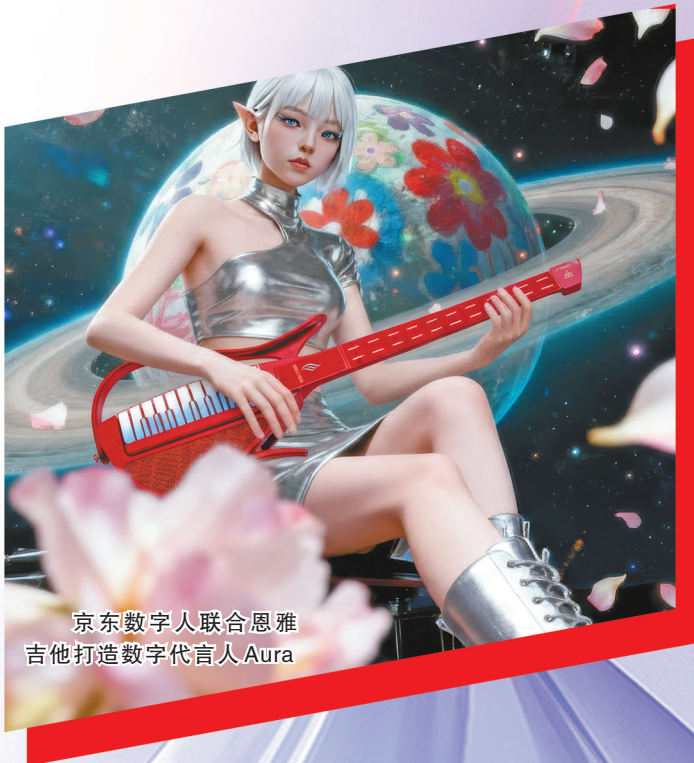
京东数字人联合恩雅吉他打造数字代言人Aura