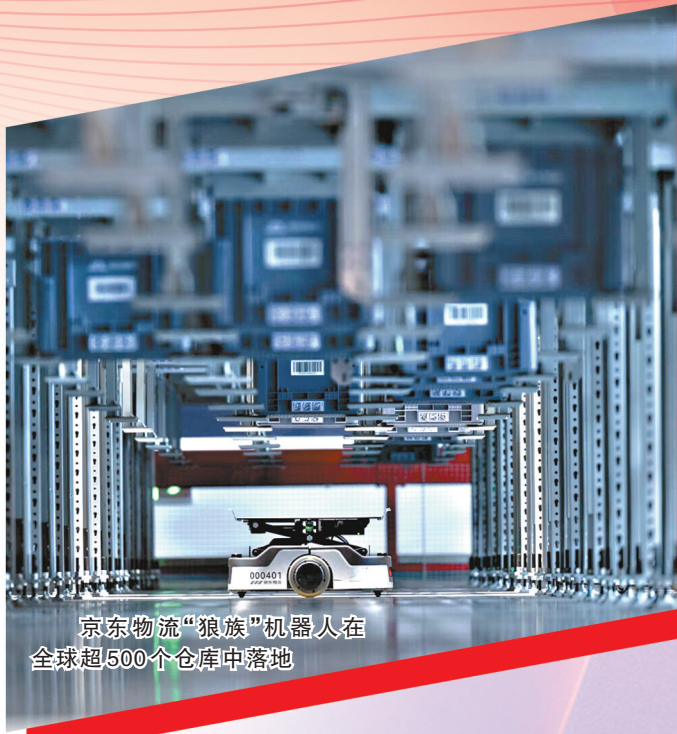
京东物流“狼族”机器人在全球超500个仓库中落地

这些场景,是京东将创立27年来积累的供应链能力与人工智能深度融合、以AI推动供应链全面重构的生动实践。