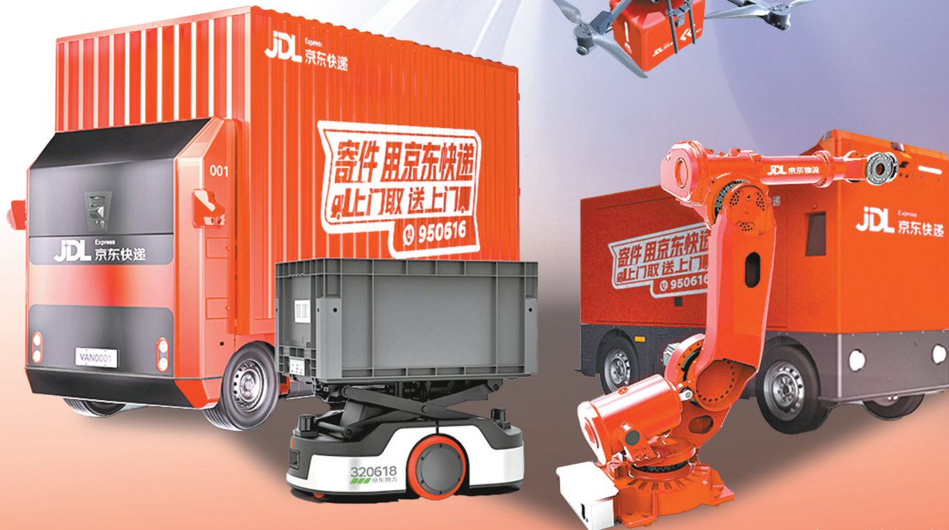
京东物流“狼族”机器人产品