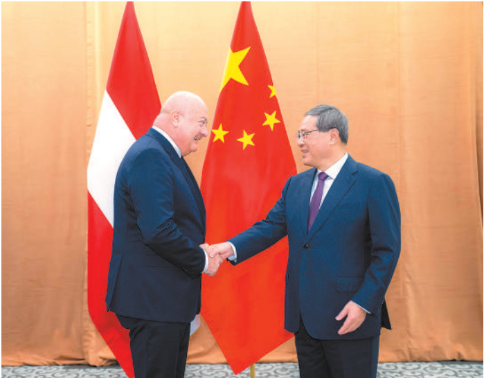
当地时间9月23日，国务院总理李强在纽约会见奥地利总理施托克尔。