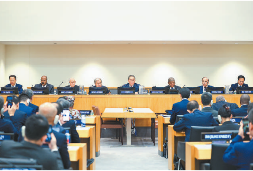
当地时间9月23日，国务院总理李强在纽约联合国总部出席由中方主办的全球发展倡议高级别会议并致辞。

本报联合国9月23日电（记者王迪、谢亚宏）当地时间9月23日，国务院总理李强在纽约联合国总部出席由中方主办的全球发展倡议高级别会议并致辞。联合国秘书长古特雷斯、哈萨克斯坦总统托卡耶夫、伊拉克总统拉希德、安哥拉总统洛伦索、安提瓜和巴布达总理布朗、巴基斯坦总理夏巴兹、尼日尔总理泽内以及30多国部长级官员、国际组织负责人与会。