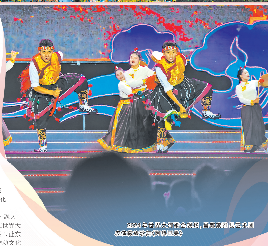
2024年世界大河歌会现场，昌都察雅县艺术团表演藏族歌舞《阿热巴芒》