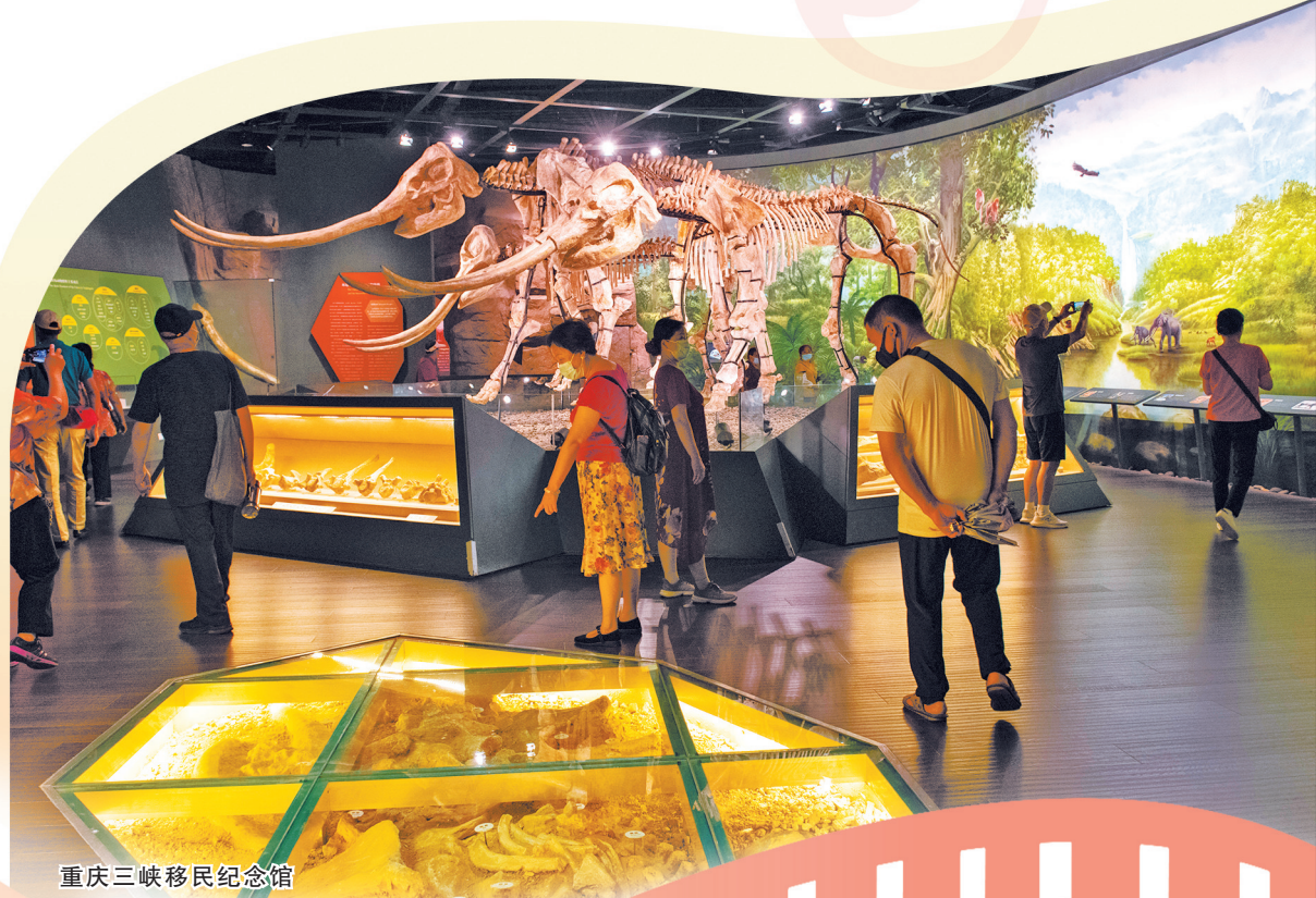
重庆三峡移民纪念馆