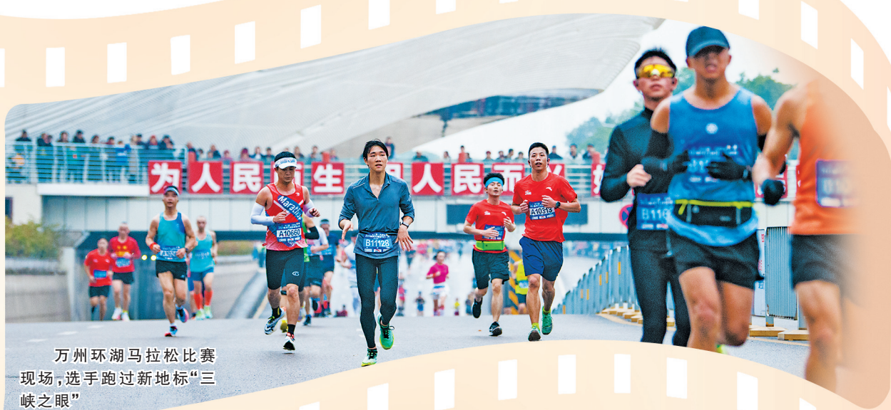
万州环湖马拉松比赛现场，选手跑过新地标“三峡之眼”