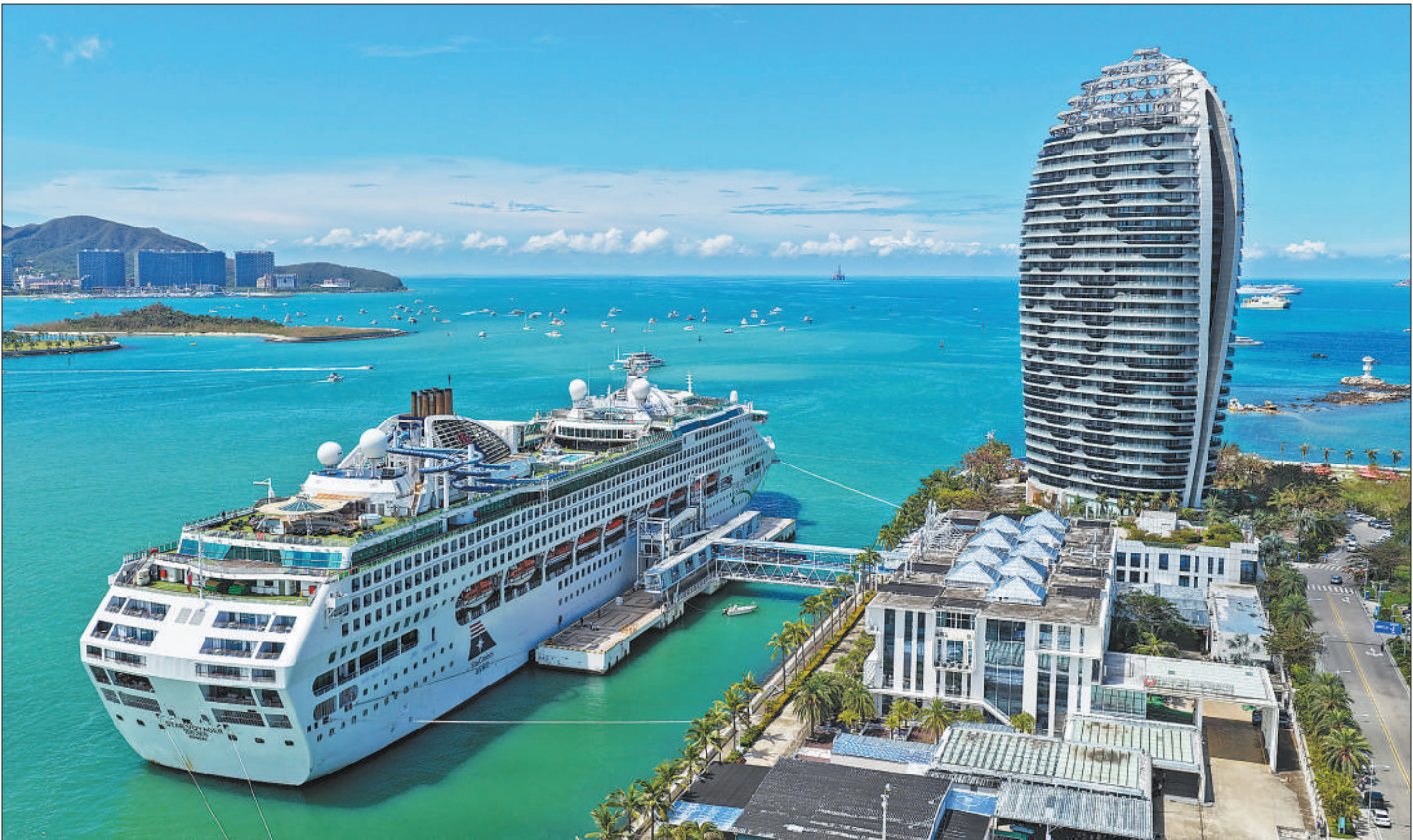
9月4日，丽星邮轮领航星号搭载来自16个国家和地区的约1200名游客访问海南三亚，开启在中国内地的首航。这标志着三亚与国际邮轮企业的合作迈入新阶段，为海南自贸港邮轮产业发展注入新活力。图为领航星号停泊在三亚凤凰岛国际邮轮港。

实体店，好逛就是竞争力，留住人是真本事。实体店与网店良性竞争、各显其能，不断推出更优质的产品和服务，定能提振消费、繁荣市场，为人民群众的美好生活添彩助力。