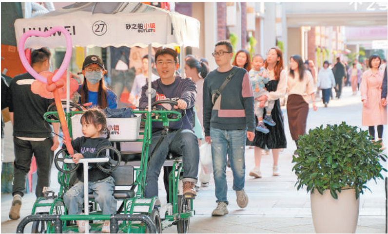
在福建福州砂之船小镇，消费者体验亲子骑游购物。