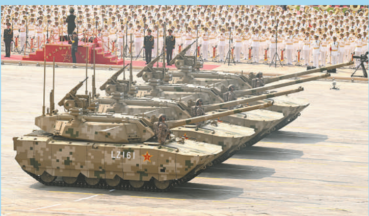
地面突击方队接受检阅。