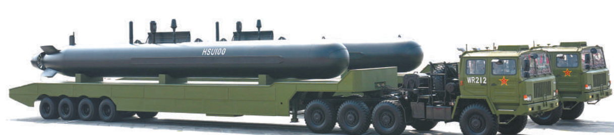
海上无人作战方队接受检阅。