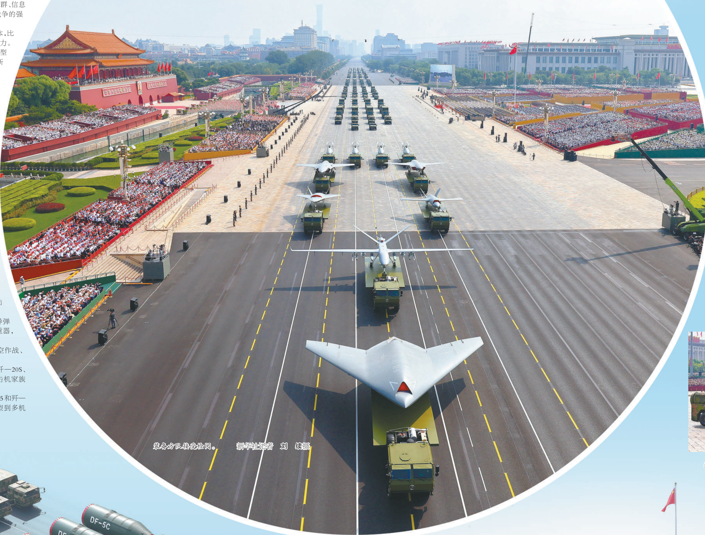
综合方队接受检阅。