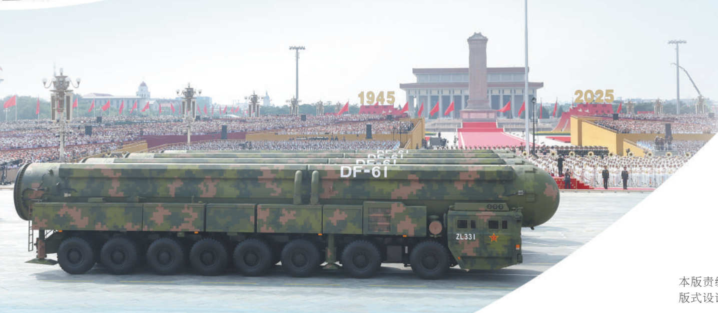
核导弹第一方队接受检阅。