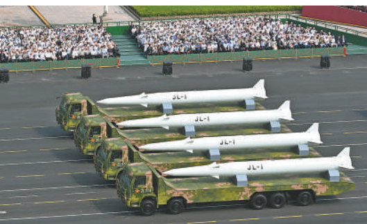
核导弹第一方队接受检阅。