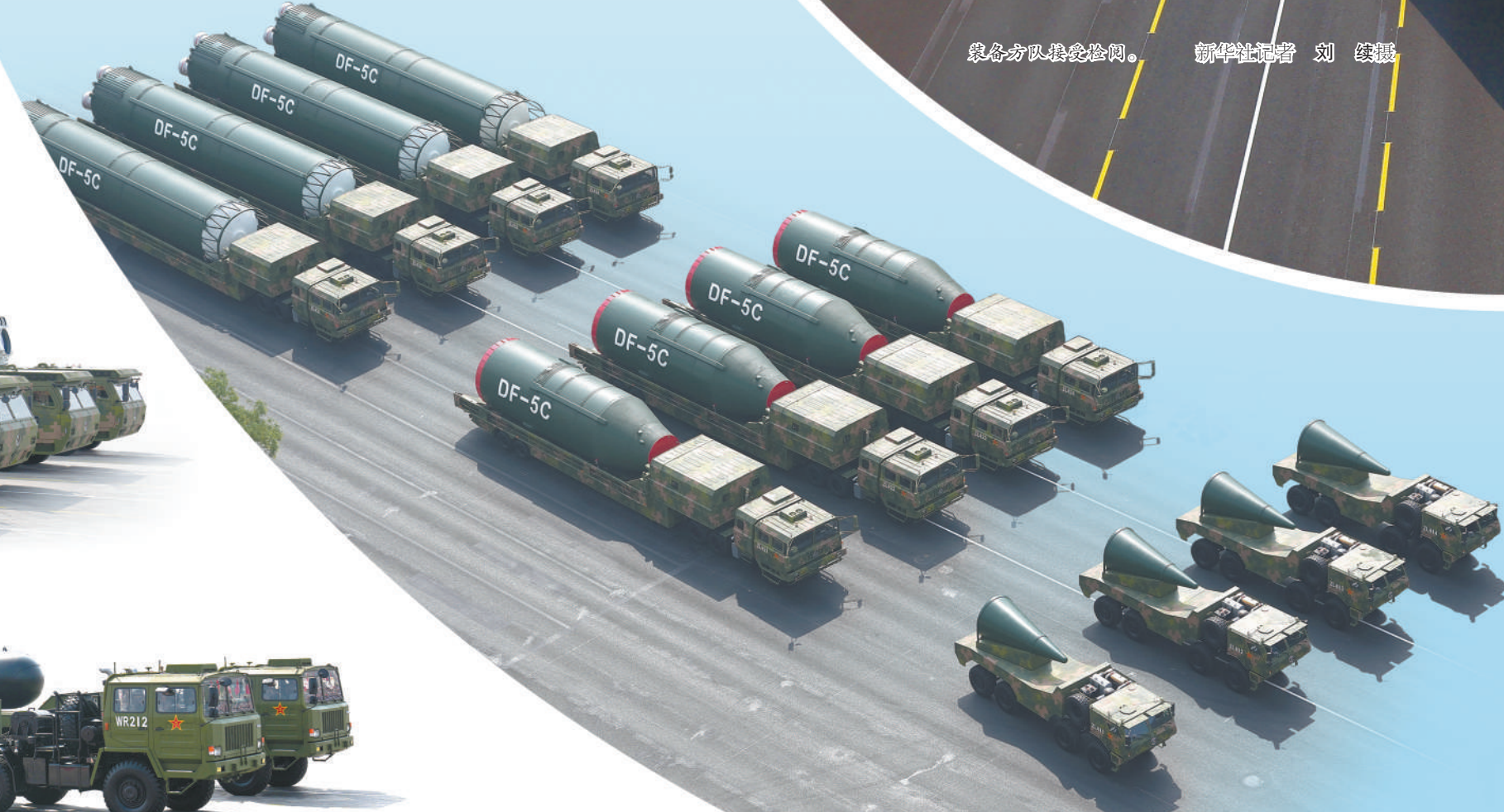
核导弹第二方队接受检阅。