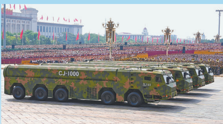
巡航导弹方队接受检阅。

本版责编:苏显龙 赵晓曦 李佩阳 叶殊凡 版式设计:蔡华伟 张芳曼 张丹峰 汪哲平