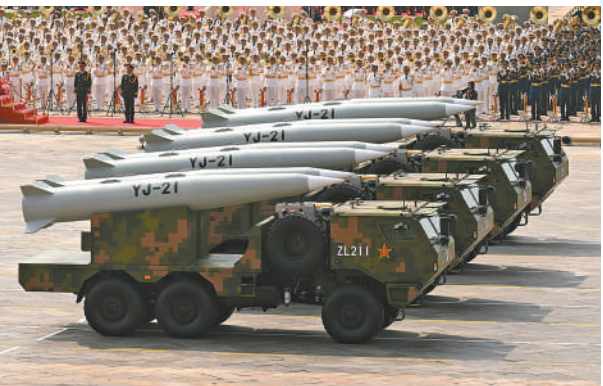
高超声速导弹方队接受检阅。