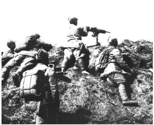
▲狮脑山战斗中八路军的机枪阵地。