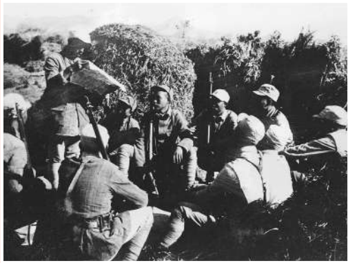
▲百团大战中国坐学习的八路军战士。