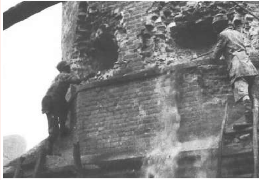
▲八路军战士在爆破新矿大烟筒。