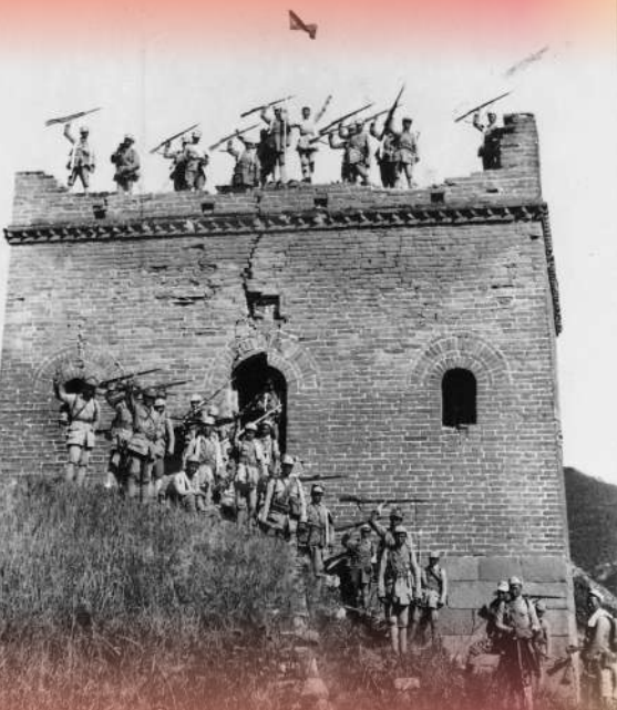
▲百团大战中攻破河北涞源东团堡后欢呼胜利的八路军战士。