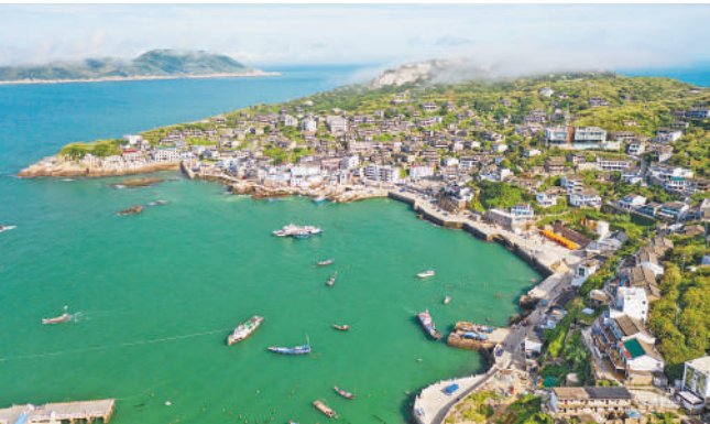
浙江舟山市普陀区东极镇庙子湖岛。