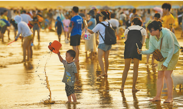
浙江舟山市朱家尖南沙景区，游客在沙滩上游玩。

（上接第一版） 消费、投资、出口，拉动经济增长的“三驾马车”。中国经济运行态势向好，在出口之韧，也在消费之旺、投资之稳。 消费回暖向好。上半年，我国社会消费品零售总额同比增长5%，服务零售额同比增长5.3%，最终消费对经济增长的贡献率达52%。 “在一系列扩内需、促消费政策带动下，消费市场趋于活跃、态势向好，这意味着下半年消费发展是有支撑的。”国家信息中心研究员杨道玲说。 投资稳步扩大。上半年，全国固定资产投资同比增长2.8%；扣除价格因素影响，同比增长5.3%。其中，制造业投资同比增长7.5%，拉动全部投资增长1.8个百分点。 “从全年看，稳投资有基础、有抓手，随着房地产市场朝着止跌回稳的方向继续迈进，新质生产力蓬勃发展，投资消费相互促进作用增强，将释放广阔投资空间。”中国宏观经济研究院研究员杜月说。 “今年以来经济运行成绩来之不易，5.3%的增长为实现全年经济社会发展目标任务奠定了比较好的基础，也增强了我们的信心。”国家发展改革委国民经济综合司司长周陈说。