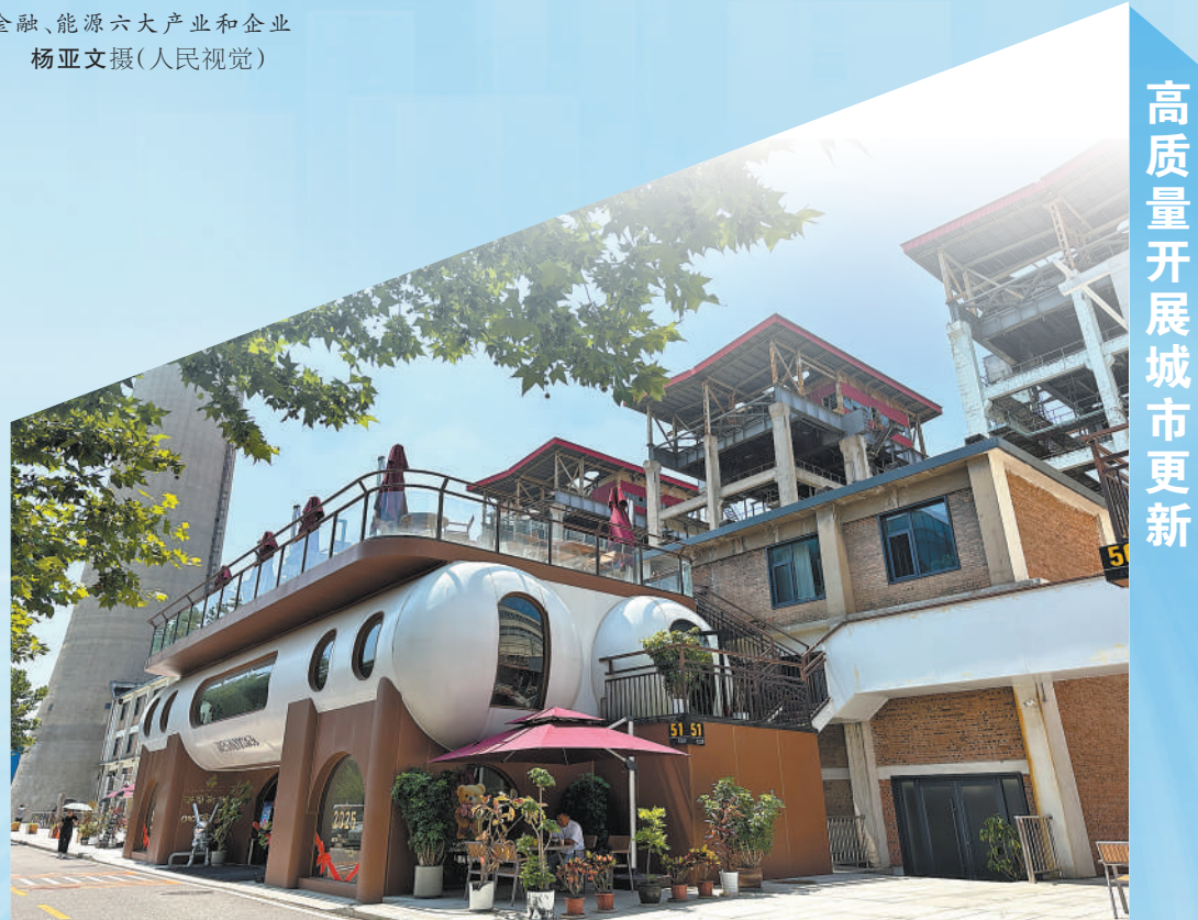
在北京市西城区“天宁1号”文化科技创新园,有一家由油罐改造而成的工业风咖啡馆。该园区前身为北京第二热电厂,如今建设为零碳智慧园区。