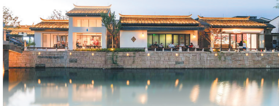
游客在上海市青浦区蟠龙天地街区水岸边休息。蟠龙古镇曾是城中村,改造后成为商业街区。