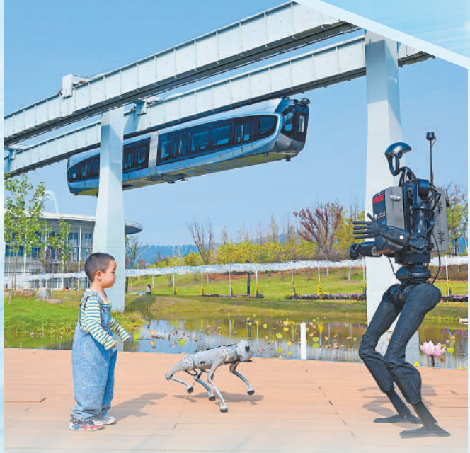
湖北省武汉市东湖高新区空轨高新大道站附近,装上“智慧大脑”的人形机器人与小朋友一起跳舞。近年来,东湖高新区通过推动科技创新和产业创新融合发展、引进拔尖科技人才等方式,构建高水平创新创业生态。

创新是决胜未来的“关键变量”“最大增量”。中央城市工作会议提出建设现代化人民城市的6个方面内涵,排在首位的就是创新,并对“着力建设富有活力的创新城市”作出具体部署。 作为经济发展的中心,城市是科技创新、产业发展的主阵地。河北雄安新区打造创新生态,对接北京邮电大学、北斗学术交流中心等高校、科研院所,提升北斗领域创新能力;湖北武汉挖掘创新资源,以东湖高新区为代表,人工智能产业发展迅速……实践告诉我们,推动城市高质量发展,必须把创新作为第一动力。精心培育创新生态,让人才、技术、资本等要素充分发挥作用,进而助推新质生产力更上一个台阶。 依靠改革开放增强城市动能,高质量开展城市更新,充分发挥城市在国内国际双循环中的枢纽作用。城市更新不是简单的“拆旧重建”,而是城市发展方式升级的高水平实践,有助于拉动内需。开展城市工作时,要统筹推进传统产业改造升级、新兴产业培育壮大、未来产业布局建设。 着力建设富有活力的创新城市,需要在发展中实现,坚持因城施策,激发创新创业活力,形成新质生产力对高质量发展的强大推动力。