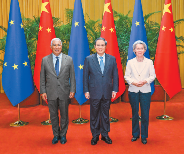
7月24日下午，国务院总理李强在北京人民大会堂同欧洲理事会主席科斯塔、欧盟委员会主席冯德莱恩共同主持第二十五次中国—欧盟领导人会晤。