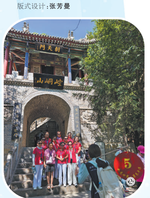
图②:旅客在崆峒山景区合影留念。