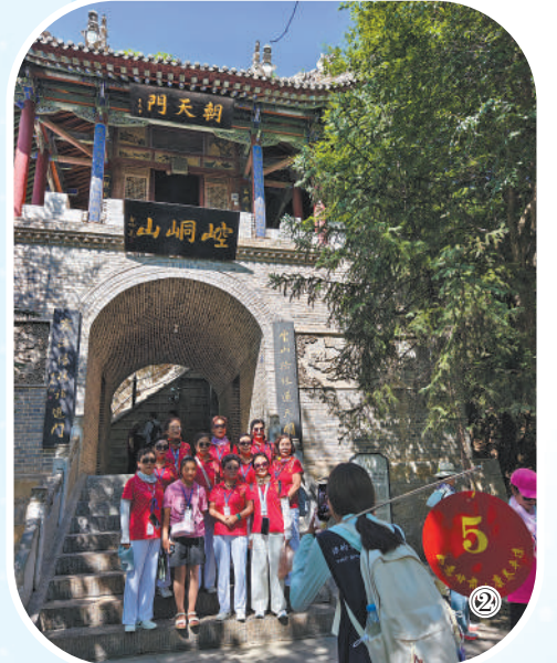
图②:旅客在崆峒山景区合影留念。