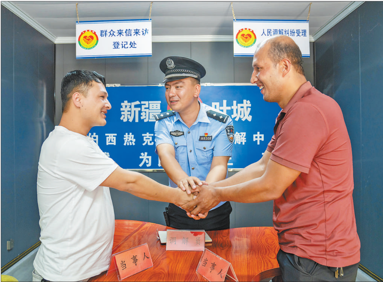
新疆维吾尔自治区喀什地区叶城县公安局伯西热克派出所践行新时代“枫桥经验”，组织民警加强走访，及时掌握社情民意，做好矛盾纠纷调处工作，助力平安乡村建设。图为民警在辖区调解中心化解一起矛盾纠纷。

据介绍，各省级广播电视台及所属新媒体、重点网络视听平台还将在重要时段、重点栏目、重要位置开设“山河见证”专题、专栏、专区，播出相关采访报道、视频节目，在黄金时段、重点栏目、重要专区展播抗战主题优秀纪录片、电视剧、网络视听节目。