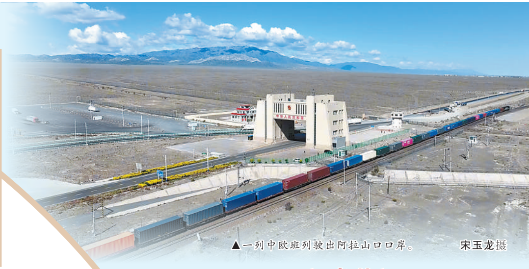
▲一列中欧班列驶出阿拉山口岸。