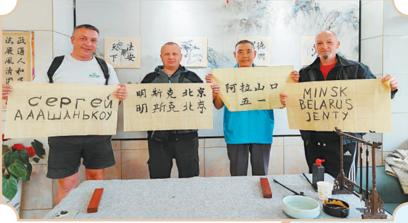
▲5月1日，阿拉山口市阿拉套街道友好社区举办书法文化交流活动，邀请50余名外籍友人参与。图为外籍友人与社区工作人员展示作品。

近40年里，这个边陲小城只有这两家单位，人烟稀少。直到1990年阿拉山口站兴建，铁路来了。同年，阿拉山口岸也正式建立。