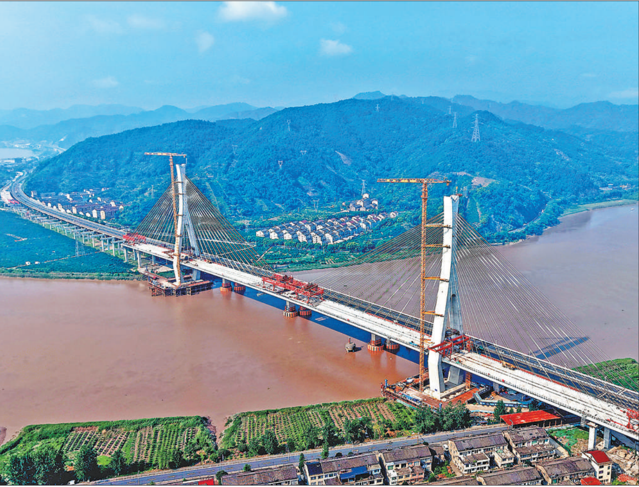
7月13日，浙江省甬台温（宁波至台州至温州）高速公路改扩建项目临海市灵江特大桥主桥顺利合龙，为2026年年底全线贯通打下坚实基础。灵江特大桥主桥全长700米，主跨380米，为双塔双索面叠合梁斜拉桥。