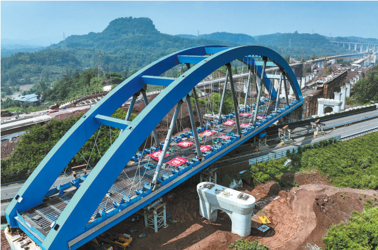
7月11日,西渝(西安至重庆)高铁跨江大桥顶推施工完成。西渝高铁是我国“八纵八横”高铁网中包(银)海、京昆通道的重要组成部分,全长739公里,设计时速350公里。该大桥位于四川省达州市,其顶推施工完成,为西渝高铁全线按期通车奠定了坚实基础。图为大桥施工现场。