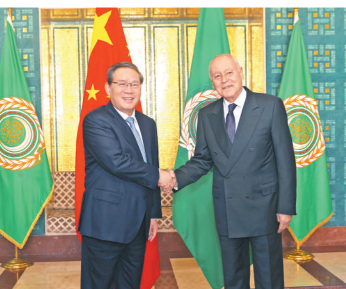
当地时间7月9日，国务院总理李强在开罗会见阿拉伯国家联盟秘书长盖特。

本报开罗7月9日电（记者黄培昭、陈尚文）当地时间7月9日，国务院总理李强在开罗会见阿拉伯国家联盟秘书长盖特。 李强表示，中国和阿拉伯国家是彼此信赖的好朋友、好伙伴。当前，在习近平主席和阿拉伯国家元首战略引领下，中阿关系进入历史最好时期。中方始终从战略高度看待和发展同