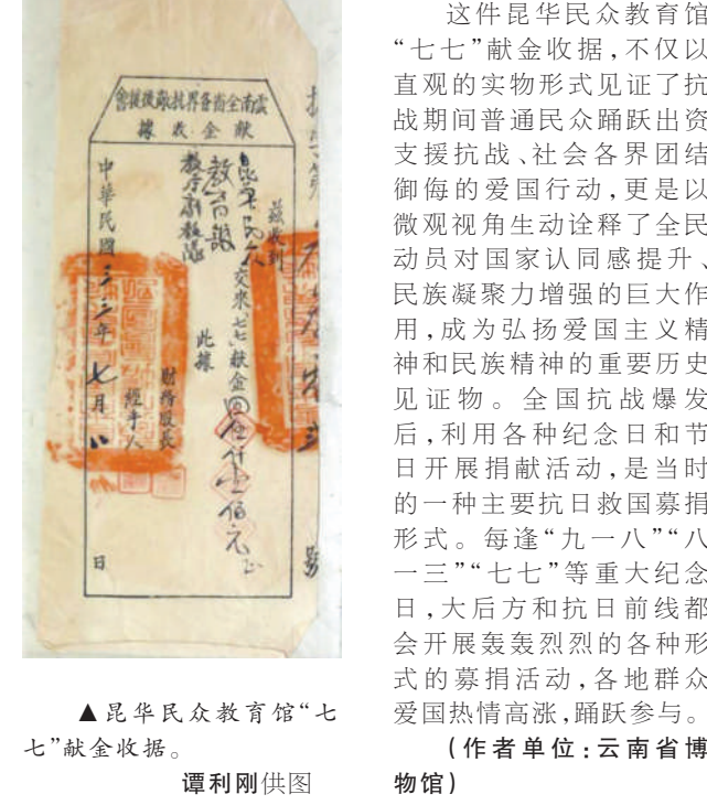
▲昆华民众教育馆“七七”献金收据。

士。一般情况下云南所募集的“七七”献金中，1/3上交全国慰劳总会，用于慰问前线作战的将士；另外1/3用于慰劳驻守在本省、抗击敌人的部队；剩下的1/3，则按照规定拨付给各县，作为慰问出征士兵家属的基金。此外，献金中极少部分也用于购置奖品。 “七七”献金运动作为全民动员劳军运动之一，在战时社会保障体系中发挥了一定作用。该运动通过募集专项款项，不仅为前线作战部队提供了必要的精神激励和物资支持，还通过发放军属抚恤金等措施，缓解了抗战将士家庭经济困境。