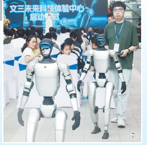
本版责编:韩秉宸 张博岚 版式设计:蔡华伟