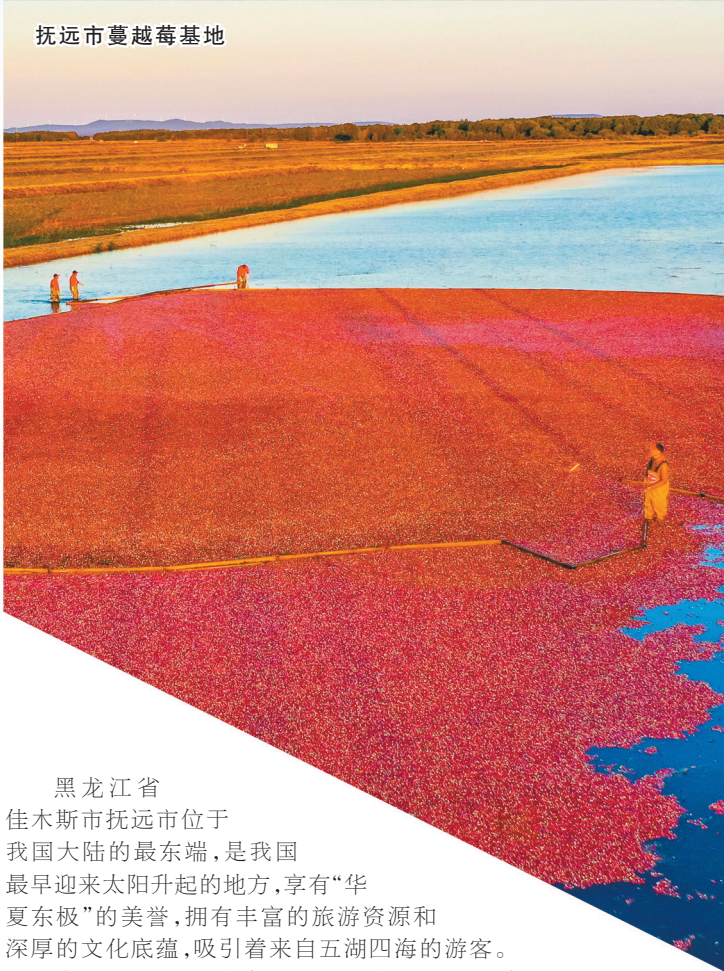
抚远市蔓越莓基地

黑龙江省 佳木斯市抚远市位于 我国大陆的最东端，是我国 最早迎来太阳升起的地方，享有“华 夏东极”的美誉，拥有丰富的旅游资源和 深厚的文化底蕴，吸引着来自五湖四海的游客。 近年来，抚远市凭借自身独特的优势，在旅游业高质量 发展的道路上阔步前行。