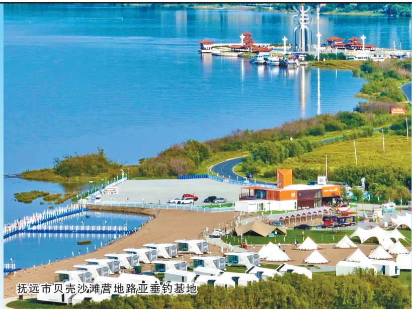
抚远市贝壳沙滩营地

步优化通关 流程，有序引导游 客排队候检，在客流密 集区域加强秩序维护，确保游 客安全、顺畅、高效通关，持续助力抚 远跨境游发展跑出“加速度”。 依托乌苏镇抓吉赫哲旅游度假区、南岗赫哲 文化体验区、贝壳沙滩营地，抚远市大力发展休闲度假 产业。结合“醉美龙江331边防公路”建设，打造自驾车、房车 营地体系，为游客提供多样化的度假选择。在贝壳沙滩营地， 游客可以倾听江水流淌，感受江风轻抚，享受惬意度假时光。 在南岗赫哲文化体验区，游客可以参与制作鱼皮画、鱼骨工艺 品等，深入了解赫哲族的传统手工艺。 抚远市积极开展体育交流活动，常态化举办多种中俄双 边及国际体育赛事，如马拉松、自行车、极限挑战、冰雪运动等 赛事，不仅吸引了众多运动员参与，还吸引了大量游客前来观 赛助威。游客可以亲身参与体育健身活动，在运动中感受抚 远的活力与魅力。每年举办的马拉松比赛，赛道沿中俄界江 黑龙江设置，选手在奔跑的过程中，既能欣赏江景，又能感受 观众的热情，运动员和观众共同打造了一场独特的体育盛会。 依托三江自然生态馆、科技馆、东极艺术馆等，抚远市结 合中小学地理国情教育要求，开展了丰富多彩的研学体验、生 态科普、自然教育活动，培育了一批研学旅行基地。在三江自 然生态馆，游客可以近距离观赏到几十种淡水鱼和三江地区 珍贵的动植物标本，探索大自然的奥秘。中国淡水鱼博物馆 则展示了各种鱼类的标本和相关知识，让游客对抚远的“鱼文 化”有更深入的了解。在东极阁、东极太阳广场、黑瞎子岛湿