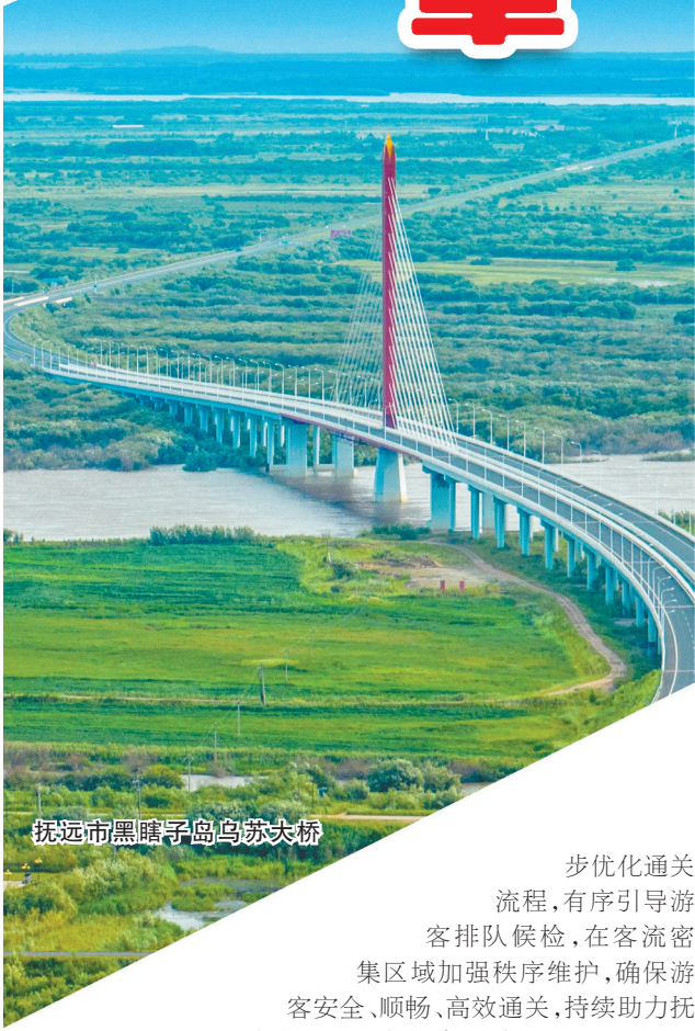
抚远市黑瞎子岛乌苏大桥

步优化通关 流程，有序引导游 客排队候检，在客流密 集区域加强秩序维护，确保游 客安全、顺畅、高效通关，持续助力抚 远跨境游发展跑出“加速度”。 依托乌苏镇抓吉赫哲旅游度假区、南岗赫哲 文化体验区、贝壳沙滩营地，抚远市大力发展休闲度假 产业。结合“醉美龙江331边防公路”建设，打造自驾车、房车 营地体系，为游客提供多样化的度假选择。在贝壳沙滩营地， 游客可以倾听江水流淌，感受江风轻抚，享受惬意度假时光。 在南岗赫哲文化体验区，游客可以参与制作鱼皮画、鱼骨工艺 品等，深入了解赫哲族的传统手工艺。 抚远市积极开展体育交流活动，常态化举办多种中俄双 边及国际体育赛事，如马拉松、自行车、极限挑战、冰雪运动等 赛事，不仅吸引了众多运动员参与，还吸引了大量游客前来观 赛助威。游客可以亲身参与体育健身活动，在运动中感受抚 远的活力与魅力。每年举办的马拉松比赛，赛道沿中俄界江 黑龙江设置，选手在奔跑的过程中，既能欣赏江景，又能感受 观众的热情，运动员和观众共同打造了一场独特的体育盛会。 依托三江自然生态馆、科技馆、东极艺术馆等，抚远市结 合中小学地理国情教育要求，开展了丰富多彩的研学体验、生 态科普、自然教育活动，培育了一批研学旅行基地。在三江自 然生态馆，游客可以近距离观赏到几十种淡水鱼和三江地区 珍贵的动植物标本，探索大自然的奥秘。中国淡水鱼博物馆 则展示了各种鱼类的标本和相关知识，让游客对抚远的“鱼文 化”有更深入的了解。在东极阁、东极太阳广场、黑瞎子岛湿