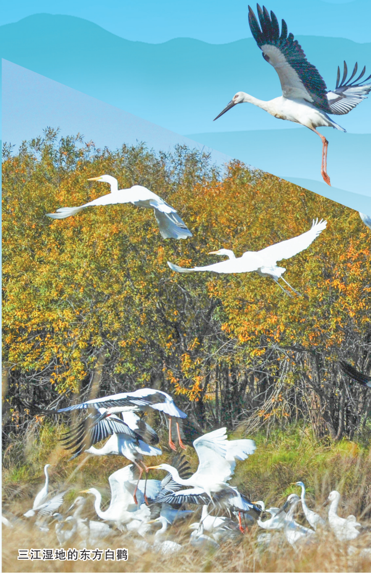
三江湿地的东方白鹤