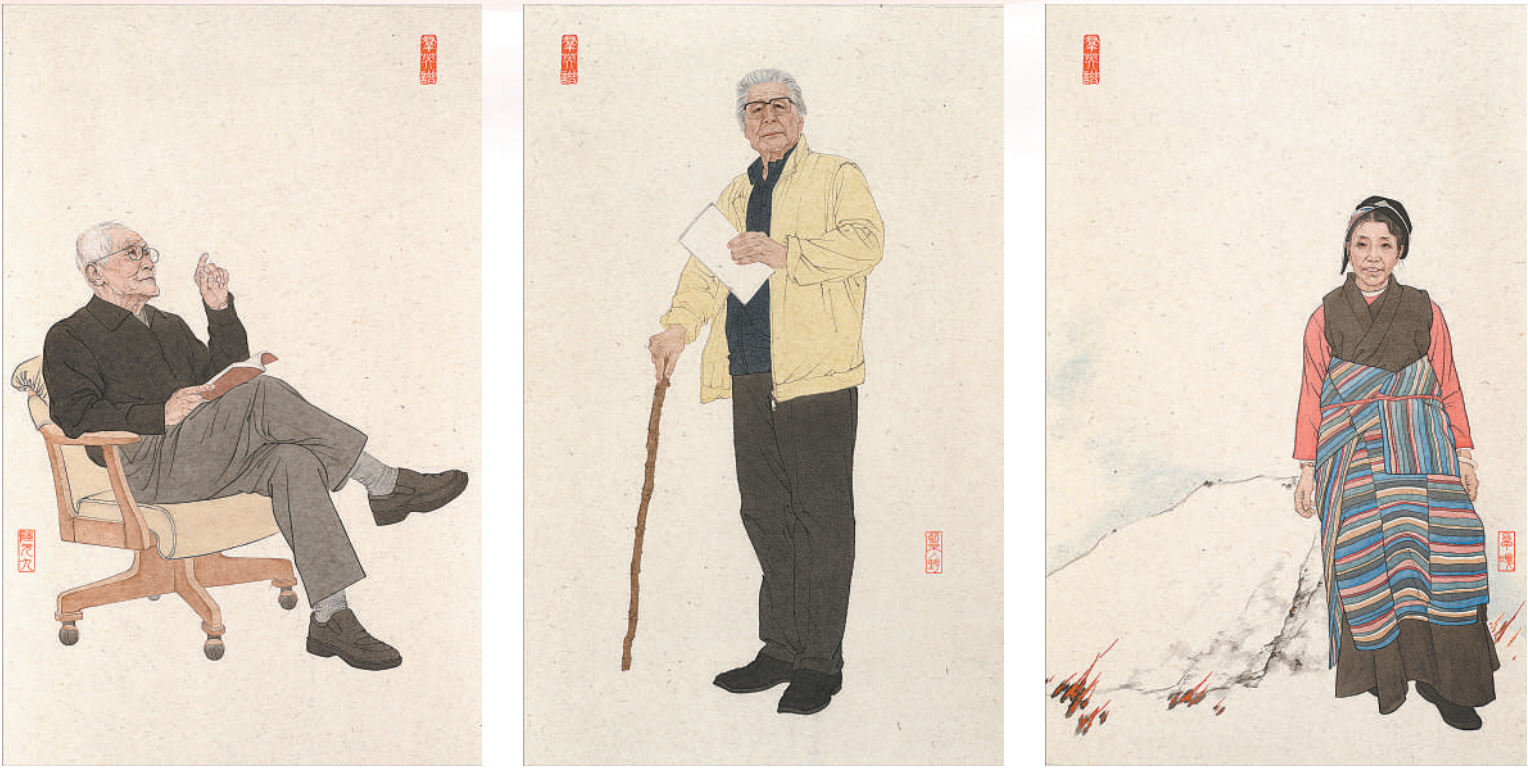
▲从左到右依次为中国画《群英谱》之“七一勋章”获得者陆元九、蓝天野、卓嘎，主创贾广健、徐展、武欣、杨可、周乐、张美中等。

在中国共产党百余年奋斗征程中，涌现出无数优秀共产党员。他们以高尚情操筑起一座座精神丰碑，激励着一代代人踔厉奋发。为平凡英雄画像、为火热时代立传，是美术工作者的责任担当。近期，在天津美术学院美术馆举办的“《群英谱》国家艺术基金美术创作资助项目汇报展”，生动呈现了各条战线优秀共产党员的精神风貌，展现了美术工作者在主题性人物画创作方面的新探索，引发广泛关注。 《群英谱》的主角，是29位“七一勋章”获得者。4年前的今天，“七一勋章”颁授仪式在人民大会堂隆重举行。29个闪亮的名字，深深镌刻在我心中。我开始思考，如何以笔墨为媒，向平凡英雄献上最深情的礼赞，将这份荣光