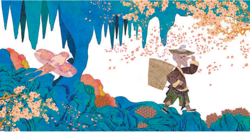
▲图画书《桃花源后记》内页，作者张妹钰。