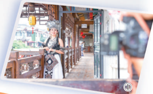
图①:在湖北恩施市,身穿土家族服饰的游客体验沉浸式旅拍。