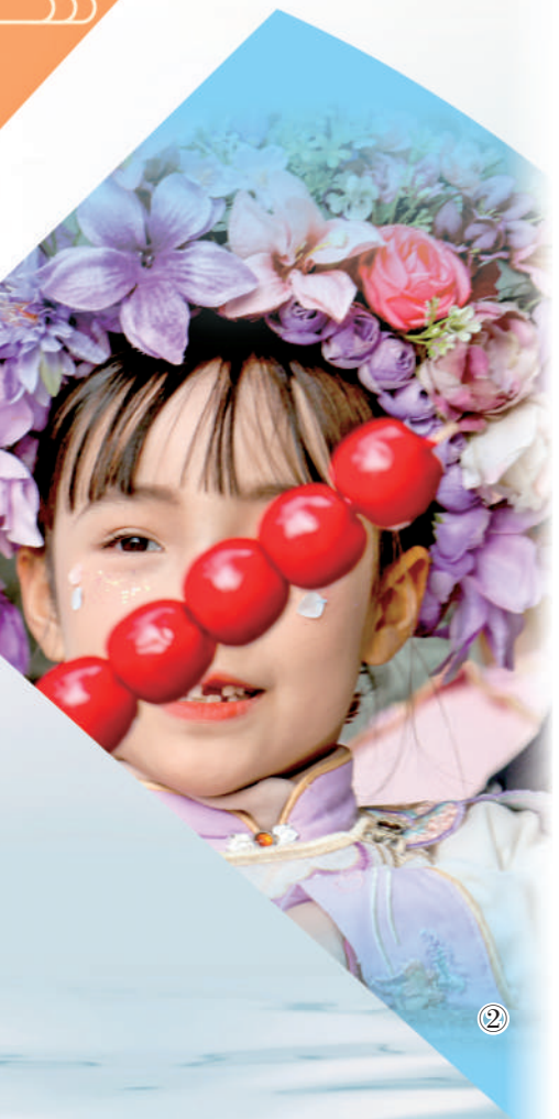
图②:游客在福建省泉州市丰泽区埭埔村头戴“簪花围”体验旅拍。