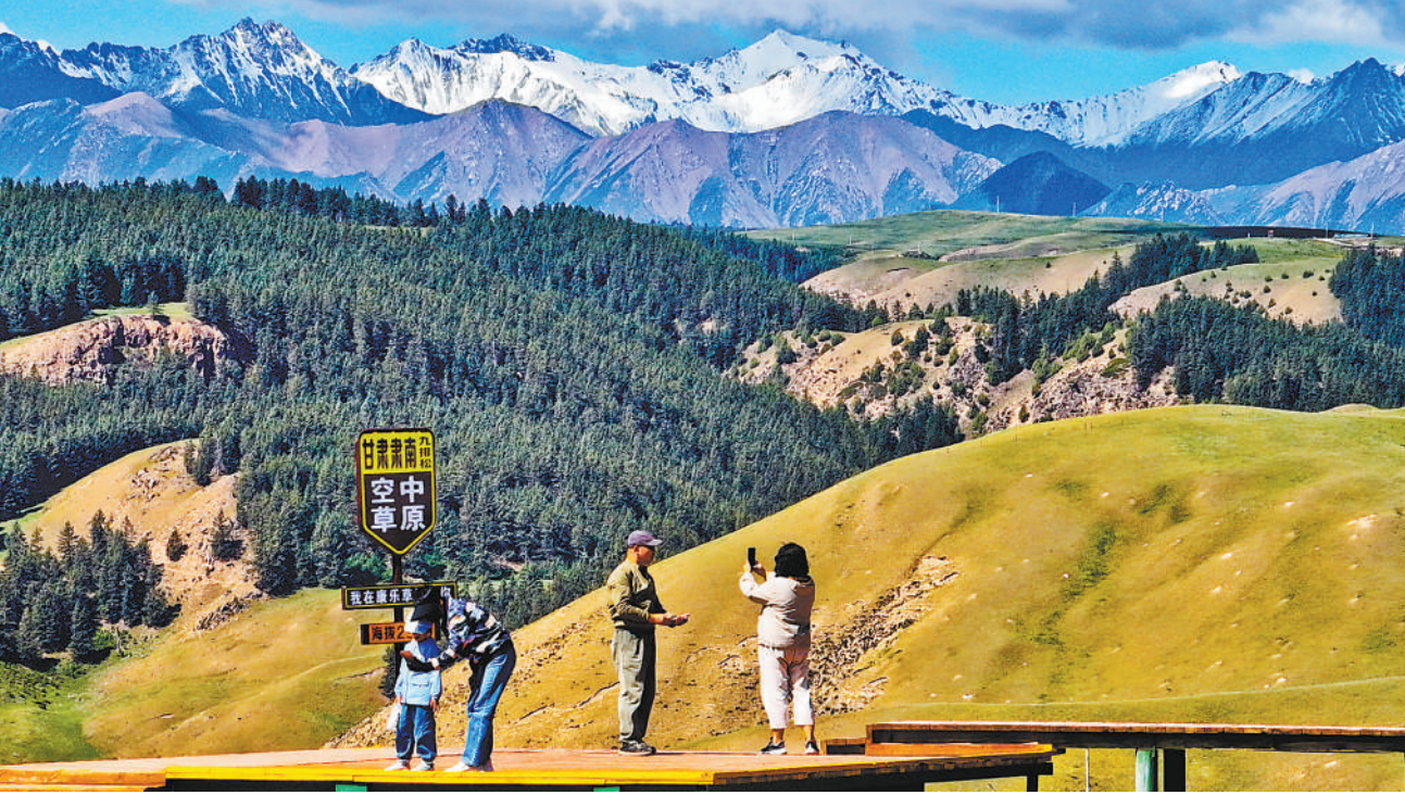
甘肃省肃南裕固族自治县坚持生态优先、绿色发展，依托自然资源优势，积极发展旅游产业，促进当地群众增收。时值盛夏，位于肃南裕固族自治县的康乐草原气候宜人，吸引各地游客前来观光。图为6月22日，游客在康乐草原赏景、拍照。