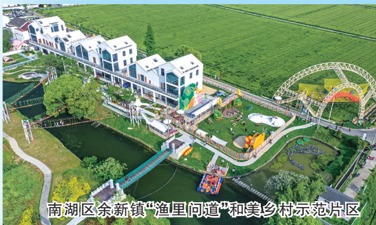
南湖区余新镇“渔里问道”和美乡村示范片区