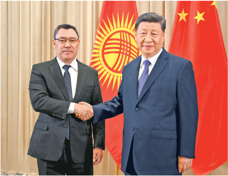
当地时间六月十七日上午，国家主席习近平在阿斯塔纳出席第二届中国—中亚峰会期间会见吉尔吉斯斯坦总统扎帕罗夫。 新华社发

（上接第一版）进一步加强执法安全和防务合作，共同打击“三股势力”，提升网络安全合作水平。 习近平强调，中国将秉持睦邻安邻富邻、亲诚惠容理念方针，以高质量共建“一带一路”为主要平台，携手包括土库曼斯坦在内的周边国家共创美好未来。中方支持土方加入世界贸易组织、办好第五次阿富汗邻国外长会，乐见土库曼斯坦作为永久中立国在国际事务中发挥更大建设性作用。愿同土