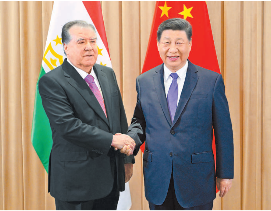
当地时间六月十七日上午，国家主席习近平在阿斯塔纳出席第二届中国—中亚峰会期间会见塔吉克斯坦总统拉赫蒙。

（上接第一版）拓展人工智能、新能源、智慧农业、公共卫生等新兴领域务实合作；积极推进互设文化中心，办好第二届百校合作论坛、持续加强减贫合作，促进两国民心相通；继续深化执法安全合作，共同打击“三股势力”，携手应对新威胁新挑战，维护地区和平稳定。双方要在中国—中亚机制、上海合作组织等多边平台加强协作，共同捍卫国际公平正义，维护国际经贸秩序。 米尔济约耶夫表示，习近平主席是世界杰出政治家，领导中国实施卓有成效的内外政策，推动经济社会发展取得丰硕成果，中国经济成为世界经济的重要引擎。当今世界任