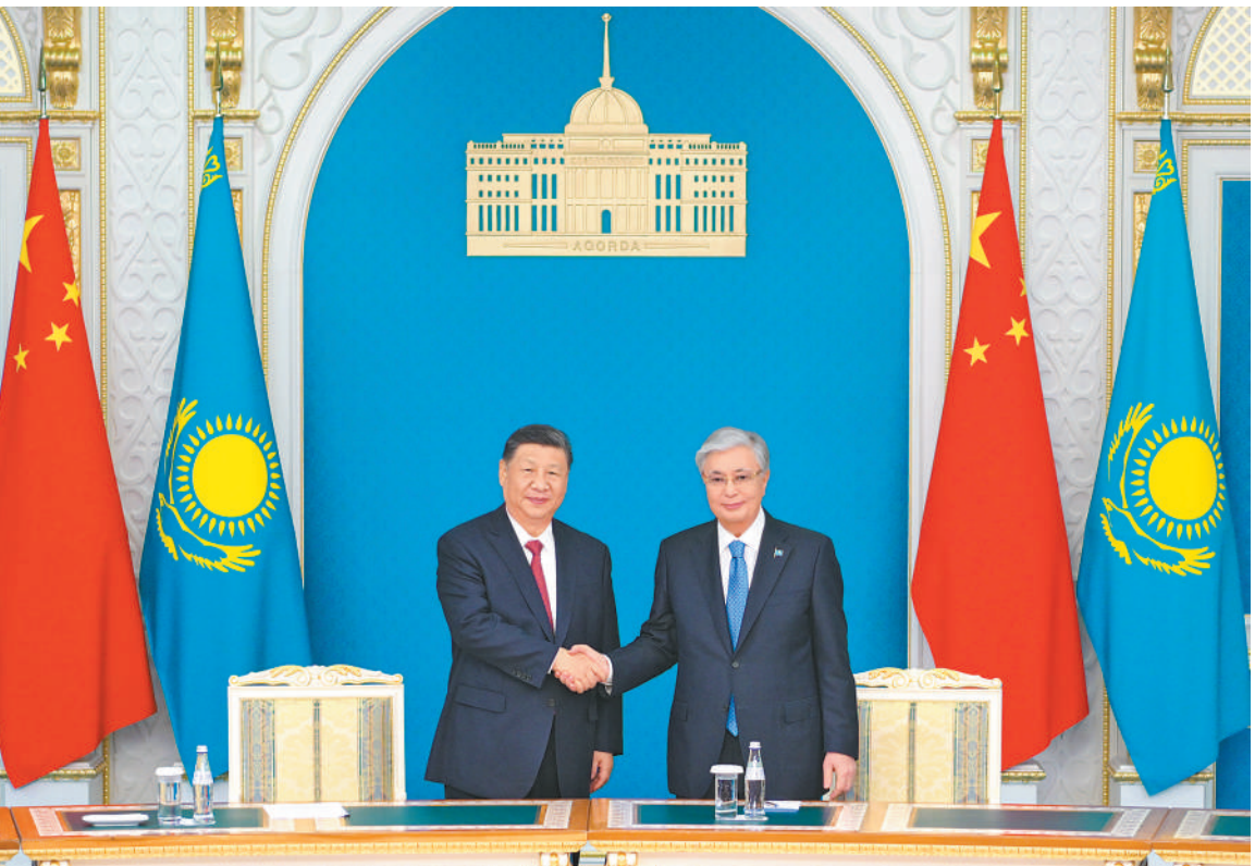
当地时间六月十六日下午，哈萨克斯坦总统托卡耶夫同中国国家主席习近平在阿斯塔纳总统府举行会谈。会谈后，两国元首共同见证双方交换十余份双边合作文件。这是习近平同托卡耶夫握手。

本报阿斯塔纳6月16日电（记者杜尚泽、杨学博）当地时间6月16日下午，哈萨克斯坦总统托卡耶夫同中国国家主席习近平在阿斯塔纳总统府举行会谈。 习近平指出，中哈关系历经国际风云变幻的考验，始终保持高水平运行，这得益于山水相连的地缘优势和世代友好的历史传承，也是两国共谋发展的必然选择。近年来，在我们共同擘画下，中哈命运共同体成色更足、内涵更丰富，实打实、惠民生的成果持续涌现，有力提升了两国人民的获得感。中方始终从战略高度和长远角度看待和发展中哈关系，愿同哈方一道，坚定不移巩固中哈友好，以中哈关系的稳定性和正能量为地区乃至世界和平和发展作出更多贡献。 习近平强调，中哈都处在各自发展振兴的关键阶段，两国要齐心协力推进全方位合作。一要以高水平战略互信引领双边关系发展，在涉及彼此核心利益和重大关切问题上继续坚定相互支持，推进发展战略对接，在乱云飞渡中做彼此坚强的后盾，在发展中做彼此有益的助力。二要以高质量共建“一带一路”促进两国合作提质升级，巩固贸易、投资、能源等传统合作优势，推进跨境铁路项目建设和口岸基础设施改造，提升互联互通水平，拓展高新技术合作，推动绿色可持续发展。三要以全方位安全合作维护两国和平安宁，扩大执法安全和防务交流，共同打击“三股势力”，深化应急管理和防灾减灾合作。四要以多元化人文交流夯实中哈友好根基，办好哈萨克斯坦“中国旅游年”，鼓励青年、媒体、智库、地方加强交流。 习近平指出，面对变乱交织的国际形势，中哈双方要坚定维护以联合国为核心的国际体系和以国际法为基础的国际秩序，践行真正的多边主义，旗帜鲜明维护广大发展中国家共同利益。中方高度评价哈萨克斯坦为第二届中国—中亚峰会所做大量筹备工作，相信这次会议将书写中国同中亚合作新篇章。同时，作为上海合作组织轮值主席国，中国愿同各成员国一道，以今年天津峰会为契机，做实做强上海合作组织，展现新发展、新突破、新气象。 托卡耶夫表示，中国是哈萨克斯坦