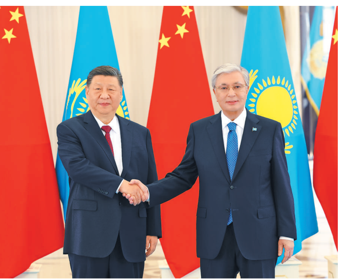
当地时间六月十六日下午，哈萨克斯坦总统托卡耶夫同中国国家主席习近平在阿斯塔纳总统府举行会谈。