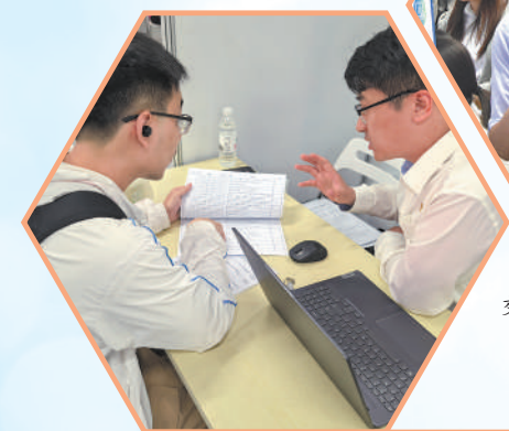
▲西安交通大学2025届就业暨2026届实习生双选会现场。