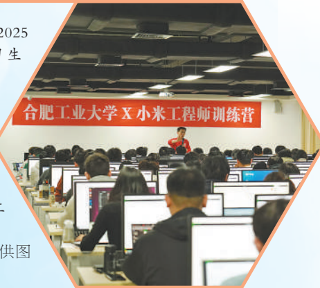
►合肥工业大学与小米集团开展工程师训练营。