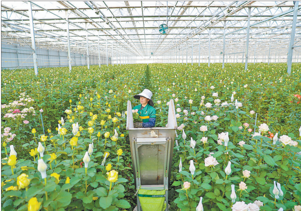
近年来,甘肃兰州新区立足优势大力发展现代生态农业,投建大型智能温室鲜花基地。产品畅销国内并出口韩国、日本等国家,形成集研发、培育、生产、销售及社会化服务于一体的特色花卉产业链。 图为6月4日,在兰州新区花卉产业基地,工人在采摘鲜切花。