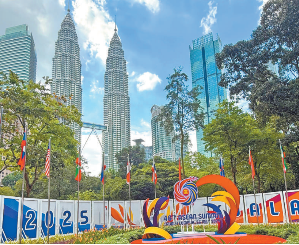
5月26日至27日，第四十六届东盟峰会在马来西亚吉隆坡举行。图为吉隆坡会议中心外的峰会标识。