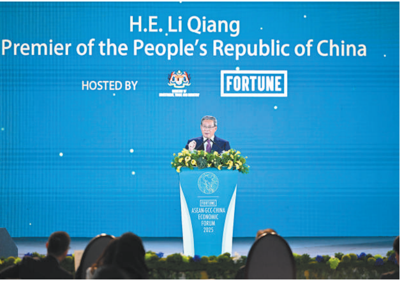
当地时间5月27日晚，国务院总理李强在吉隆坡同马来西亚总理安瓦尔、越南总理范明政共同出席东盟—中国—海合会三方经济论坛开幕式并致辞。