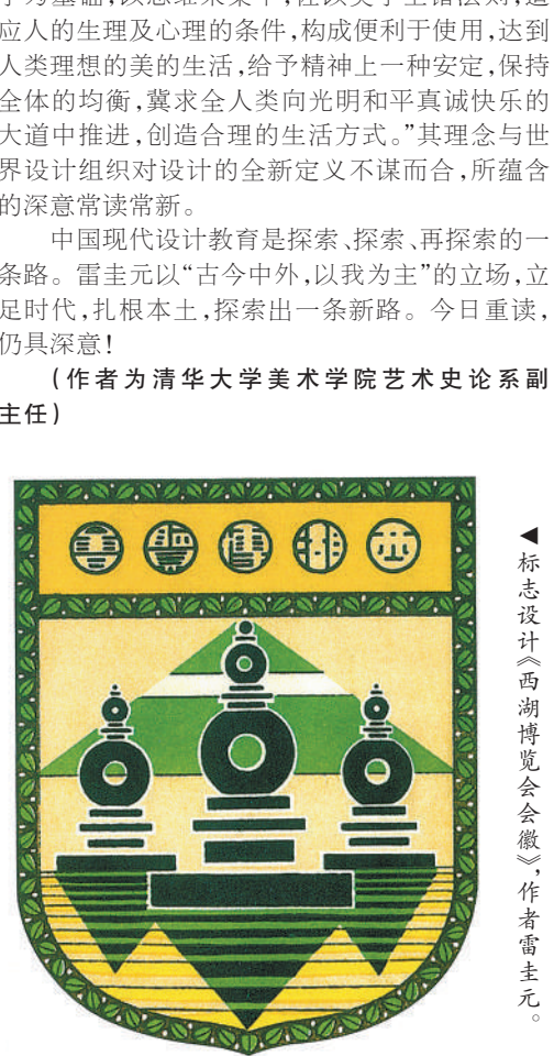
▲标志设计《西湖博览会会徽》，作者雷圭元。