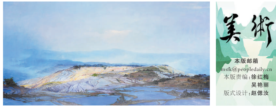
►油画《加榜梯田》，作者徐里。

记忆中的草垛子，总是“堆”起人们的乡愁，成为乡间独特的风景。江苏扬州沙头村，一座以草垛子为设计灵感书房，将乡愁与诗意相融，在田园间若隐若现。线条笔挺的木质结构框架撑起建筑主体，圆形屋顶覆盖着厚实的茅草，天然的材质肌理与简洁的空间造型，使草垛子书房与江南圩田相谐适。