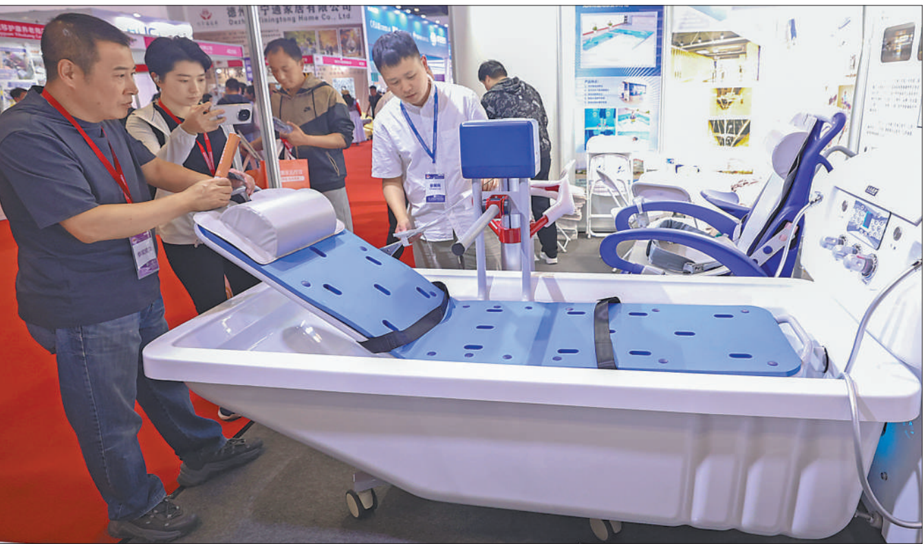
5月21日，第十一届中国国际养老服务业博览会上，工作人员在展示卧式沐浴系统。当日，博览会在北京国家会议中心开幕。展会设涉养老服务人才培养展区、养老金融与法律服务展区、老年健康食品展区等10个展区。