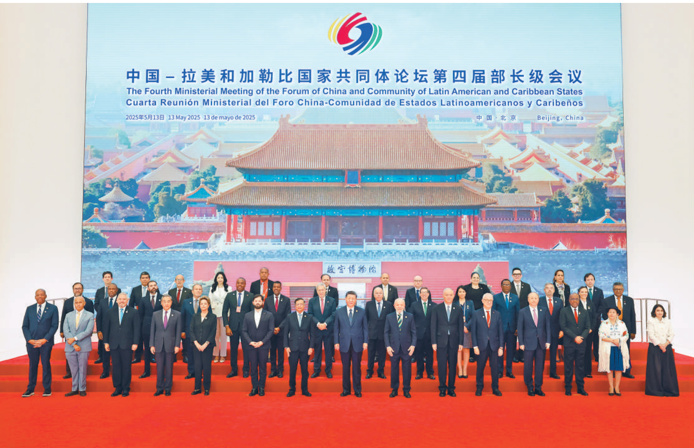
5月13日上午，国家主席习近平在北京国家会议中心出席中国—拉美和加勒比国家共同体论坛第四届部长级会议开幕式并发表主旨讲话。这是习近平同与会嘉宾集体合影。

本报北京5月13日电（记者胡泽曦、王嶸）5月13日上午，国家主席习近平在国家会议中心出席中国—拉美和加勒比国家共同体论坛第四届部长级会议开幕式并发表主旨讲话。习近平宣布，中方同拉方携手启动五大工程，共谋发展振兴，共建中拉命运共同体。 初夏时节，生机盎然。国家会议中心内，中国、拉美和加勒比国家国旗以及有关地区组织旗帜交相辉映。 习近平同拉共体轮值主席国哥伦比亚总统佩特罗、巴西总统卢拉、智利总统博里奇、拉美和加勒比国家以及地区组织代表团团长亲切握手并集体合影。 在热烈的掌声中，习近平发表题为《谱写构建中拉命运共同体新篇章》的主旨讲话。（讲话全文见第二版） 习近平指出，我同拉美和加勒比国家代表一道，在北京出席中拉论坛首届部长级会议开幕式，宣告中拉论坛成立。10年来，在双方精心培育下，中拉论坛已经从一棵稚嫩幼苗长成挺拔大树。双方携手并肩、相互支持，拉美和加勒比建交国始终坚持一个中国原则，中方坚定支持拉方走符合自身国情的发展道路，支持拉方维护国家主权独立、反对外部干涉；双方勇立潮头、合作共赢，顺应经济全球化大势，推动贸易、投资、金融、科技、基础设施建设等领域务实合作不断深化，高质量共建“一带一路”；双方守望相助、共克时艰，积极开展防灾减灾救灾合作，携手应对飓风、地震等自然灾害和世纪疫情；双方团结协作、勇于担当，践行真正的多边主义，共同维护国际公平正义，推动全球治理体系改革，促进世界多极化和国际关系民主化。事实证明，中拉已经成为携手共进的命运共同体，其鲜明底色是平等相待，强大动力是互利共赢，胸怀品格是开放