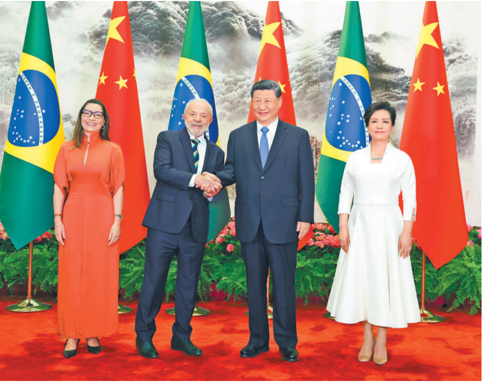
5月13日下午，国家主席习近平在北京人民大会堂同来华进行国事访问的巴西总统卢拉举行会谈。这是习近平和夫人彭丽媛同卢拉和夫人罗桑热拉合影。

“汉语桥”项目来华团组名额，实施300个“小而美”民生项目，支持拉共体成员国开展中文教育。中方将首批向拉美和加勒比地区5个国家实施免签政策，并适时扩大对地区国家覆盖范围。 习近平最后强调，无论国际风云如何变化，中国始终做拉美和加勒比国家的好朋友、好伙伴，同拉方在各自现代化征程上并肩前行，共同谱写构建中拉命运共同体新篇章。 拉共体轮值主席国哥伦比亚总统佩特罗、巴西总统卢拉、智利总统博里奇，新开发银行行长、巴西前总统罗塞芙分别致辞。拉共体候任轮值主席国乌拉圭总统奥尔西特别代表宣读总统贺信。他们高度评价拉中论坛10年发展取得的丰硕成果，赞赏中国为推动拉中合作、促进拉美经济社会发展作出的重大贡献。各方重申坚定支持一个中国原则。各方表示，习近平主席提出的构建人类命运共同体理念和三大全球倡议，为世界开辟了和平繁荣进步的光明前景。面对充满不确定性的世界，拉中应携手合作、同舟共济，推动拉中命运共同体建设不断取得新进展，共创拉中合作美好未来。拉中双方要坚持相互尊重，坚定支持对方维护主权和自主选择发展道路；加强拉美各国发展战略同“一带一路”倡议对接，推动贸易、投资、基础设施、农业、科技、新能源、教育合作，实现互利共赢；推动文明交流对话，增进拉中人民相知相亲；坚定维护联合国权威，维护世界地区和平稳定，支持多边主义、自由贸易，反对单边主义、保护主义、强权政治和霸凌行径，维护全球南方国家共同利益。 当天中午，习近平为与会拉方领导人及各代表团团长举行欢迎宴会。 蔡奇、尹力等出席上述活动。 王毅主持开幕式。