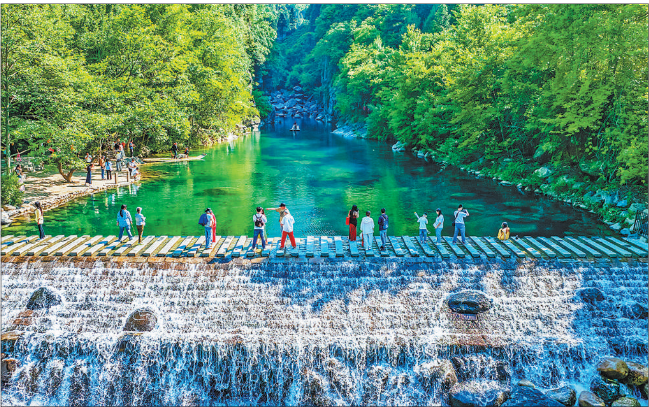
5月11日，安徽省池州市石台县牯牛降风景区，游客在美丽的龙门潭游玩，乐享周末。

重点区域、重点领域，加快推进绿色低碳转型，努力打造美丽中国建设的先行示范标杆。 三地共同制定了加快推动通武廊交界重点区域产业创新发展实施方案，提出实施重点产业链群培育、科技成果转化落地、重点园区合作共建、产融服务助企赋能等行动，打造京津冀重点产业链群、协同培育新质生产力的重要阵地。 三地共同编制了促进京津冀区域科技成果转化的若干措施，聚焦贯通科技成果转化链条、增强多领域场景应用等6个方面，明确了19项具体举措，助力京津冀更好发挥引领全国高质量发展动力源作用。 三地在深入走访调研、广泛征求意见的基础上，起草了关于发挥社会组织作用激发京津冀市场活力的意见，围绕促进产业协同、推动政企沟通等4个方面，明确了16项具体举措，着力打造新的经济增长点。 为加快培育改革开放新动力，提升国际合作和竞争新优势，三地联合