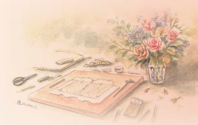
上图：《微相入：妙手修古书》书中插画《书香与花香》。