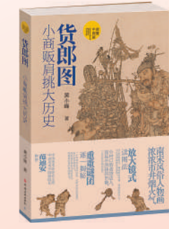
《货郎图：小商贩肩挑大历史》：黄小峰著；河南美术出版社出版。