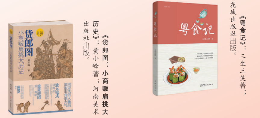
《粤食记》：三生三笑著；花城出版社出版。