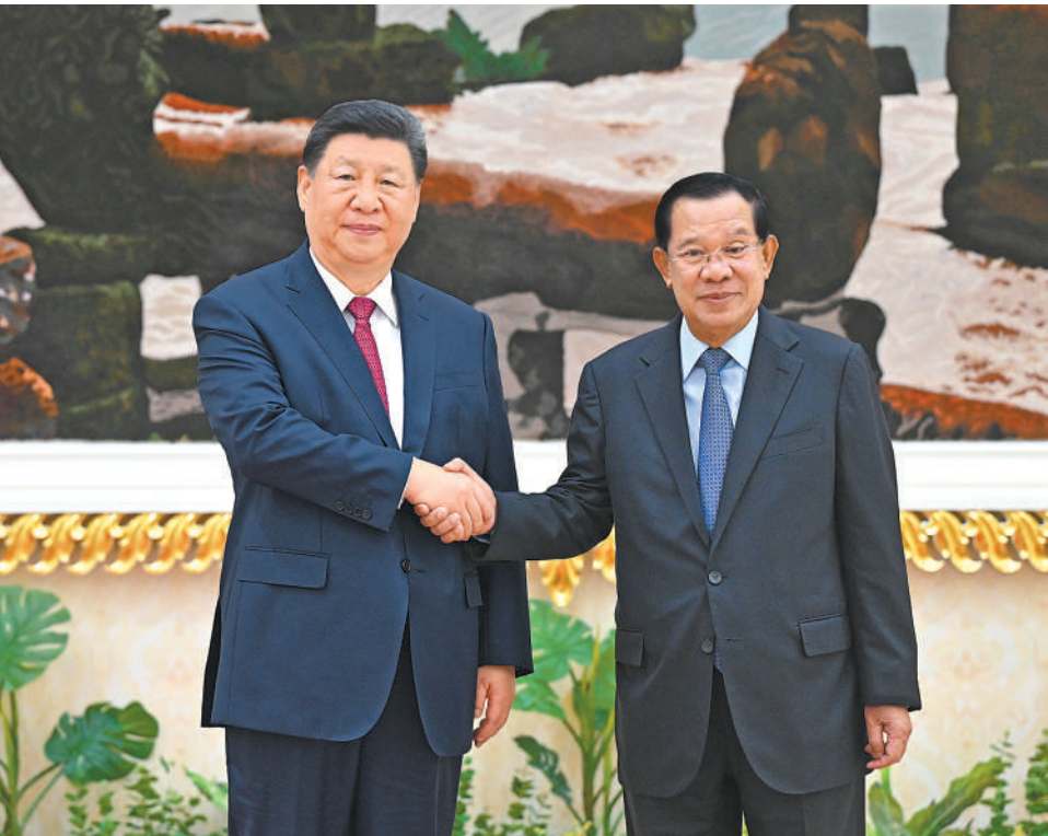
4月17日下午，国家主席习近平同柬埔寨人民党主席、参议院主席洪森在金边和平大厦举行会见。

本报金边4月17日电 （记者强薇、曹师韵）4月17日下午，国家主席习近平同柬埔寨人民党主席、参议院主席洪森在金边和平大厦举行会见。 习近平指出，中柬两国是友好邻邦，更是铁杆朋友。构建中柬命运共同体是历史的选择、人民的选择。当前，中柬两国都处在国家发展的关键阶段，双方要心系人民福祉，胸怀人类进步，在推进各自现代化进程中，为构建人类命运共同体树立典范，携手做世界百年变局中的和平力量、稳定力量、进步力量。