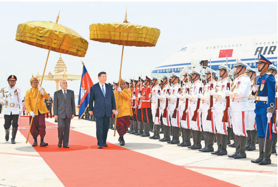
当地时间四月十七日上午，国家主席习近平乘专机抵达金边，应柬埔寨国王西哈莫尼邀请，对柬埔寨进行国事访问。西哈莫尼在机场为习近平举行隆重欢迎仪式。这是习近平在西哈莫尼陪同下检阅仪仗队。

本报金边4月17日电 （记者王洲、程是颢）当地时间4月17日上午，国家主席习近平乘专机抵达金边，应柬埔寨国王西哈莫尼邀请，对柬埔寨进行国事访问。 习近平乘专机抵达金边国际机场时，西哈莫尼国王率夏卡朋亲王、阿伦公主等王室成员，人民党主席、参议院主席洪森，国会第一副主席钱业以及